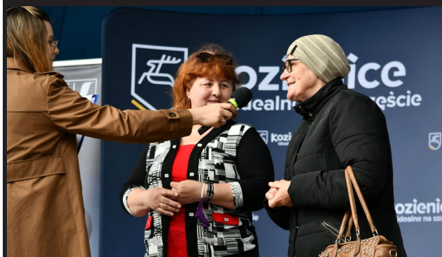
Kolejną atrakcją wydarzenia był quiz wiedzy na temat działalności kozienickiego uniwersytetu.