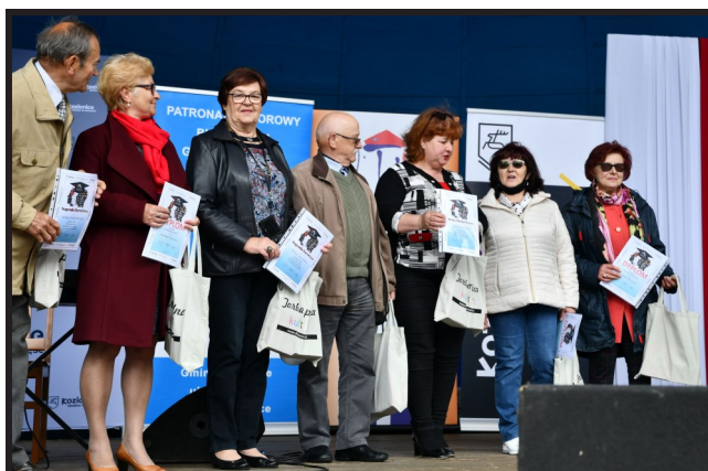
Uroczystość zakończenia roku akademickiego to doskonała okazja, aby przyznać nagrody dyrektora szczególnie ambitnym studentom, a także podziękować za współpracę Radzie Słuchaczy UTW. To dzięki zaangażowaniu naszych seniorów uniwersytet może tak pięknie się rozwijać. Współpraca z nimi przebiega wzorowo.