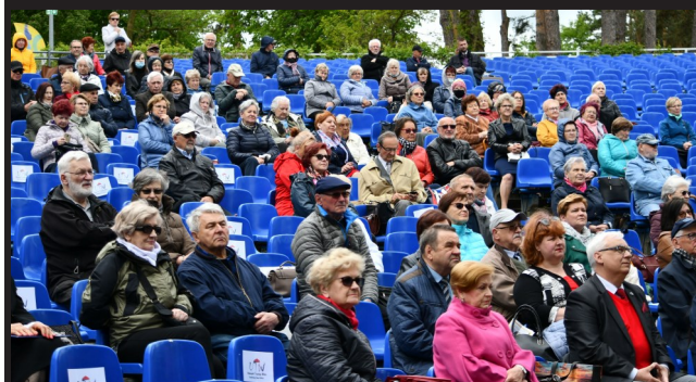
Na szczęście, tego dnia, aura nam dopisała i – mimo niesprzyjających prognoz – nie padało.