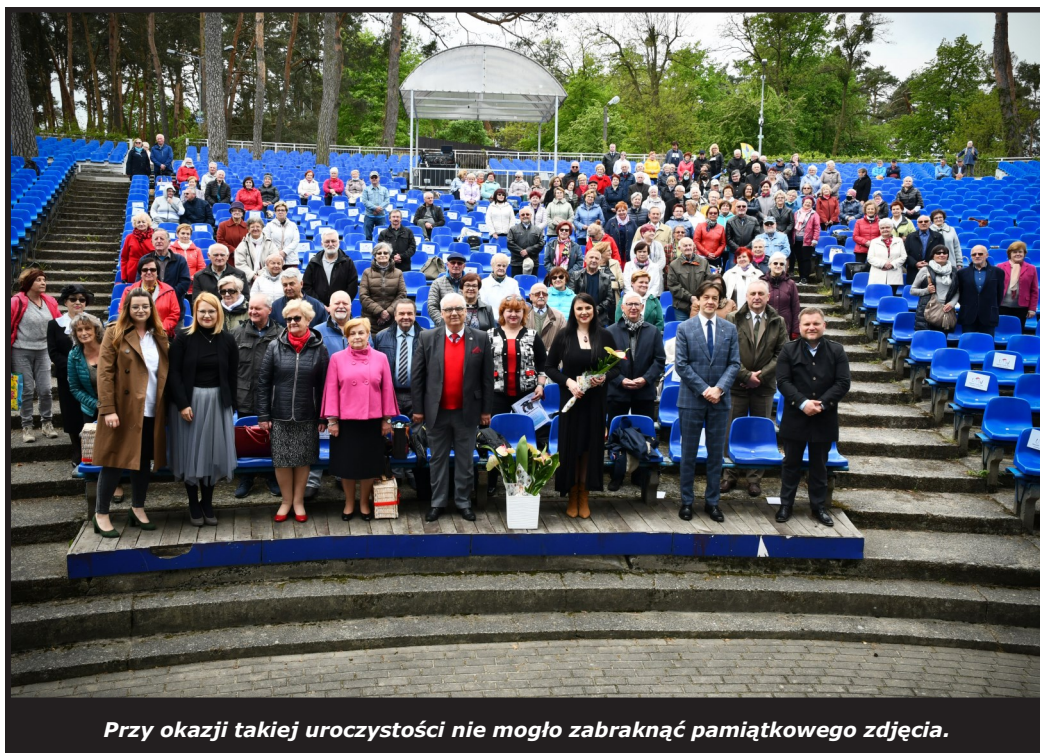
Przy okazji takiej uroczystości nie mogło zabraknąć pamiątkowego zdjęcia.

To było niezwykle zakończenie roku akademickiego 2020/21 na Uniwersytecie Trzeciego Wieku Kozienickiego Domu Kultury im. Bogusława Klimczuka. W środę, 19 maja, seniorzy spotkali się w amfiteatrze nad Jeziorem Kozienickim, by podsumować minione miesiące (głównie wirtualnej) nauki.