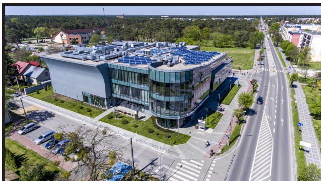
Drzwi Centrum Kulturalno-Artystycznego ponownie są otwarte dla mieszkańców i gości spoza Gminy Kozenice. Czekamy na Państwa!