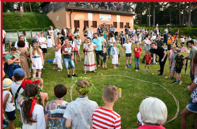
Impreza spotkała się z dużym zainteresowaniem, a chętnych do wspólnych zabaw nie brakowało.