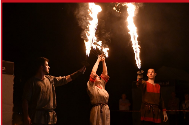
Artyści z Teatru Ognia „AMATUM” dali naprawdę gorący pokaz pt. „Noc Świętojańska”.