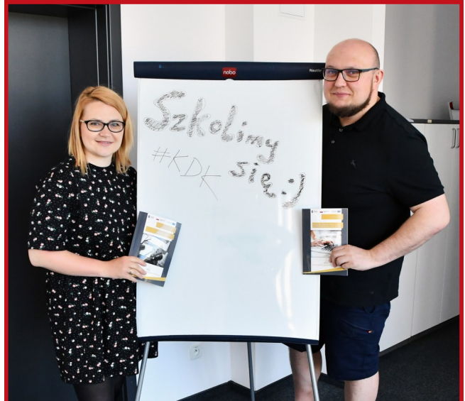
Szkolenia odbywały się w formule on-line, a nasi instruktorzy łączyli się z prelegentami ze stanowisk w Centrum Kulturalno-Artystycznym.

Projekt realizowany jest w ramach Europejskiego Funduszu Rozwoju Regionalnego w Programie Operacyjnym Polska Cyfrowa, Oś priorytetowa: III. Cyfrowe kompetencje społeczeństwa. Działanie: 3.2 Innowacyjne rozwiązania na rzecz aktywizacji cyfrowej.