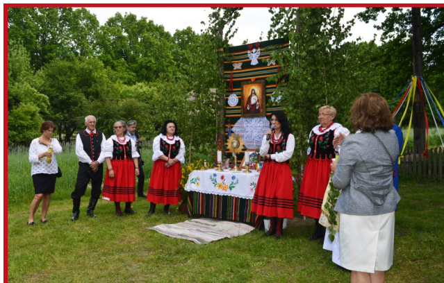
Nasi twórcy od wielu lat przygotowują piękne ołtarze.