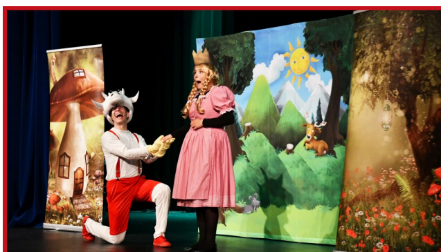
Koziołek do Pacanowa nie trafił, ale odnalazł miłość.

Chociaż wydarzenie odbywało się na zasadach reżimu sanitarnego to maluchy i tak doskonale się