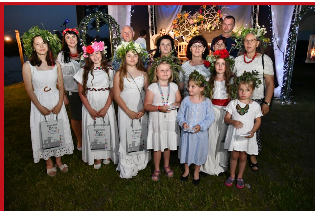
Laureatki konkursów na najpiękniejszy tradycyjny strój oraz wianek wraz z jurorami.

Impreza wystartowała punktualnie o godz. 20.00 i trzeba zauważyć, że spotkała się z bardzo dużym zainteresowaniem. Jeszcze przed startem nabrzeże zaczęło wypełniać się ludźmi, którzy od pierwszych minut bardzo aktywnie uczestniczyli w poszczególnych atrakcjach, jakie przygotowaliśmy na ten wieczór.