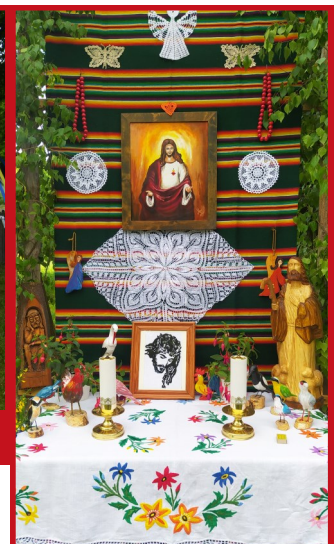
Efekt twórczej pracy.

Do przygotowania go wykorzystali między innymi rzeźby, koronki, obrazy czy kwiaty.