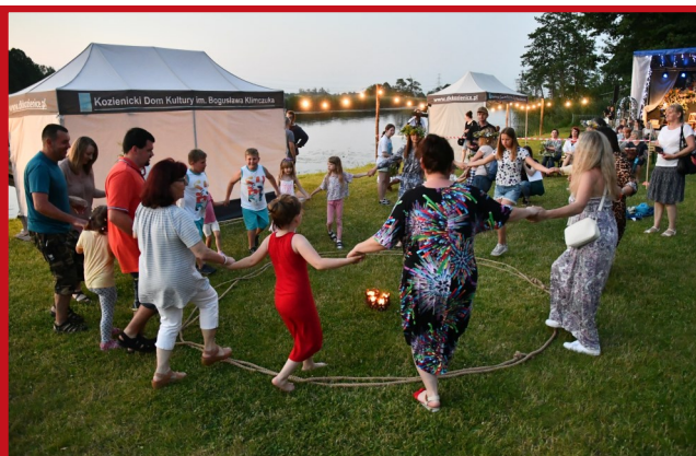
Taniec stanowi bardzo ważną część tradycyjnych obrzędów, więc nie mogło zabraknąć tego elementu.