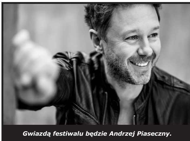
Gwiazdą festiwalu będzie Andrzej Piaseczny.