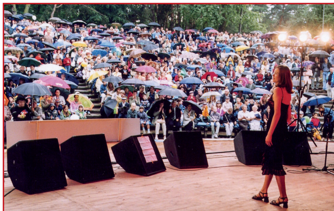
Od drugiej edycji, czyli od 2003 r., festiwal gości w amfiteatrze nad Jeziorem Kozienickim.

Festiwal „przeżył” też wiele innych inicjatyw