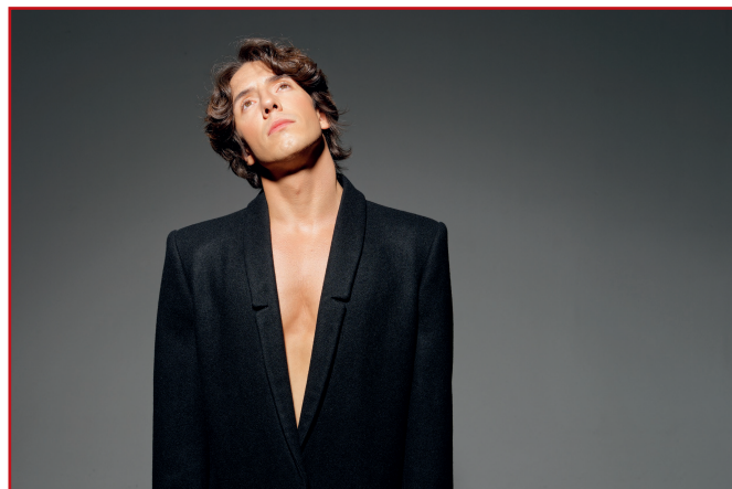
Gwiazdą tegorocznej edycji festiwalu będzie Dawid Kwiatkowski!

Kolejnym punktem programu będzie koncert „Wspomnienie o Bogusławie Klimczuku” , tym razem w wykonaniu naszego zespołu festiwalowego, stworzonego przez Piotra Wrombla specjalnie z okazji jubileuszu. W trakcie koncertu na widzów czekać będzie miła niespodzianka.