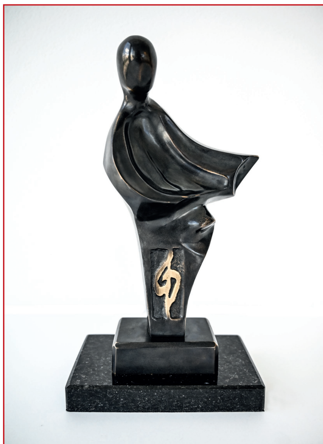
Laureat nagrody Grand Prix, oprócz czeku, otrzyma także wyjątkową statuetkę. Jej wymiary to: 28 x 15,5 x 9 cm.

Sylwetki uczestników Koncertu Finałowego prezentujemy na stronach 4-7 niniejszego wydania specjalnego „Magazynu Kulturalnego KDK”. Zachęcamy do dopingowania Waszych faworytów!