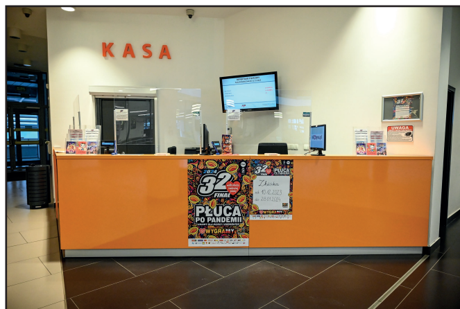
Firmowa Puszka Stacjonarna WOŚP dostępna będzie w kasach KDK do dnia wielkiego finału.

– Jestem przekonana, że jak co roku, wiele osób wesprze Orkiestrę poprzez naszą skarbonę. To oczywiście nie jedyne nasze działania związane z najbliższym finałem akcji. Ponownie bowiem