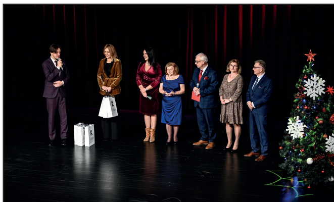
Spotkanie było okazją do złożenia życzeń świątecznych oraz noworocznych.