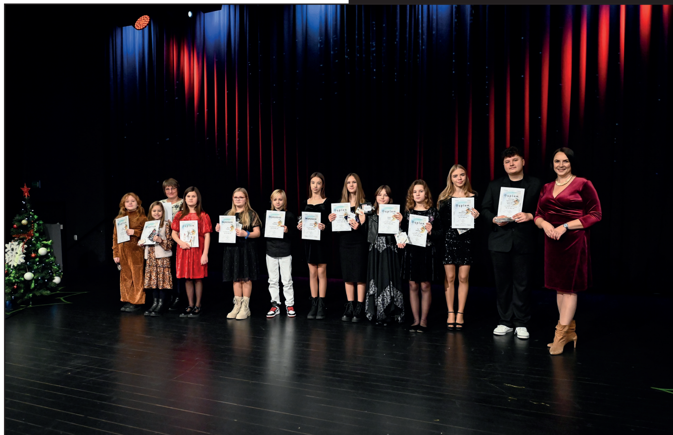
Częścią tego świątecznego spotkania był Koncert Galowy Laureatów XIV Konkursu Kolęd i Pastoralek „Na ten Nowy Rok”, po którym nastąpiło oficjalne wręczenie nagród jego uczestnikom.