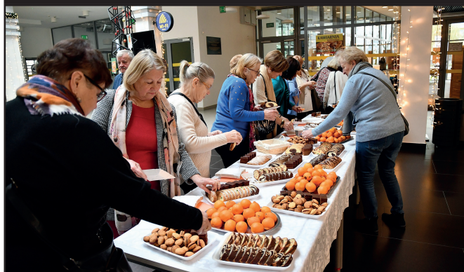
Rada Słuchaczy przygotowała dla studentów słodki poczęstunek, m.in. ciasta oraz mandarynki.