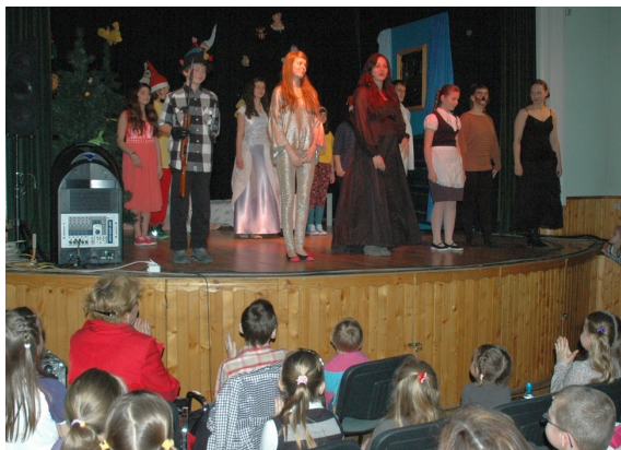
Młoda publiczność brawami podziękowała aktorom za występ.

Młodzieżowa grupa teatralna „Stojący ludzie” działająca przy Kozienickim Domu Kultury udanie zadebiutowała podczas niedzielnego poranka teatralnego dla dzieci. Młodzi aktorzy wystawili bajkę „Królewna Śnieżka i Siedmiu Krasnoludków”.