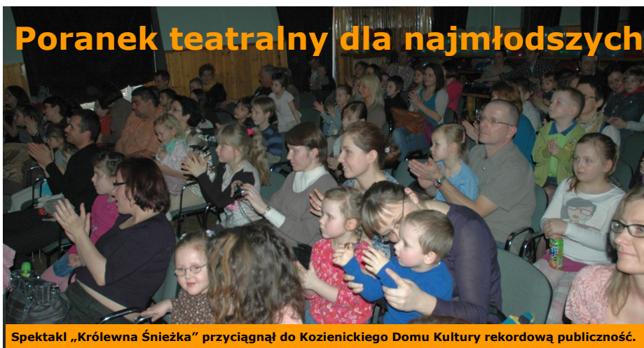
Spektakl „Królewna Śnieżka” przyciągnął do Kozienskiego Domu Kultury rekordową publiczność.