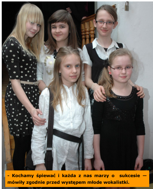
- Kochamy śpiewać i każda z nas marzy o sukcesie – mówili zgodnie przed występem młode wokalistki.

W eliminacjach środowiskowych 17. Ogólnopolskiego Konkursu Piosenki „Wygraj Sukces”, które odbyły się w Kozienickim Domu Kultury 25 marca wzięło udział niespełna czterdziestu wykonawców. Do kolejnego etapu jurorzy zaprosili dziesięciu.