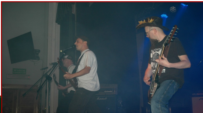
DIZEL W KDK WYSTĄPIŁ PO RAZ PIERWSZY

Już o godzinie 18.00 Dom Kultury wypełnili fani muzyki rockowej w każdym wieku. Jako pierwszy wystąpił zespół Dizel. Zagrane przez niego utwory trafiły bardzo celnie w upodobania widowni i zaczęła się szalona zabawa. Z wyjątkowo miłym przyjęciem spotkał się także zespół heRRmo, który pojawił się na scenie zaraz po Dizlu. Wśród zebranych, można było zauważyć stałych fanów kozienickiej twórczości. Po około godzinnym koncercie zaplanowano dodatkową atrakcję, a mianowicie losowanie gadżetów