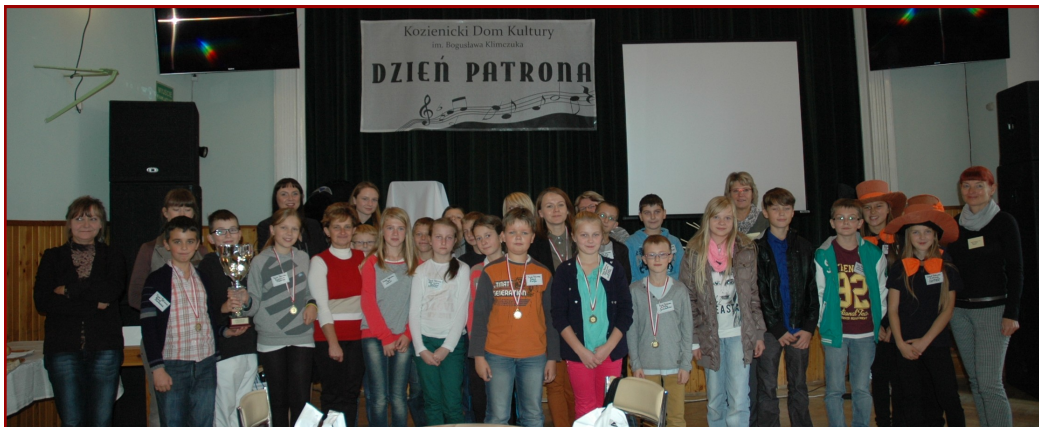
UCZESTNICY OBCHODÓW DNIA PATRONA

„Rude Rydze”, „Zielone jabłka”, „Melomani”, „Diabełki”, „Wolanie”, „Stany” i „Drużyna S-1”, w sumie siedem trzyosobowych zespołów wzięło udział w konkursie zorganizowanym przez KDK w ramach obchodów Dnia Patrona.