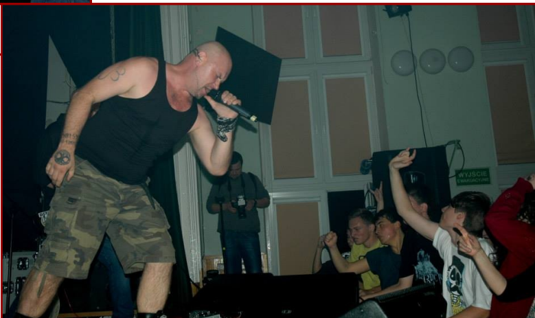
INKWIZYCJA DAŁA NIEZAPOMNIANY KONCERT