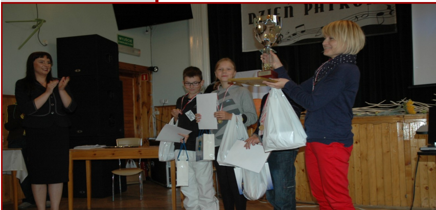
MELOMANI Z NOWEJ WSI ODEBRALI PUCHAR Z RĄK DYREKTOR KDK