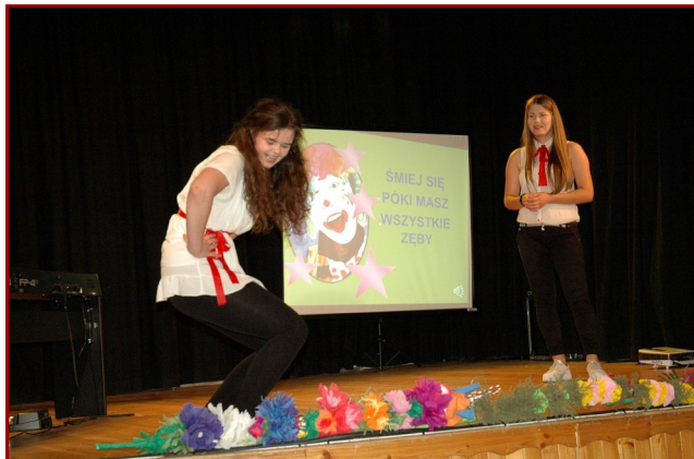
INGA I BERNA - ZWYCIĘZCZYNI II KOZIENICKIEGO SLAMU KABARETOWEGO

- Jest ciężko, nie ukrywajmy. Trzeba być cały czas skupionym, dokładnie słuchać partnerów na scenie i pilnować swoich postaci - tym kim jesteśmy. Ale cały czas ćwiczymy i staramy się być coraz lepsi.