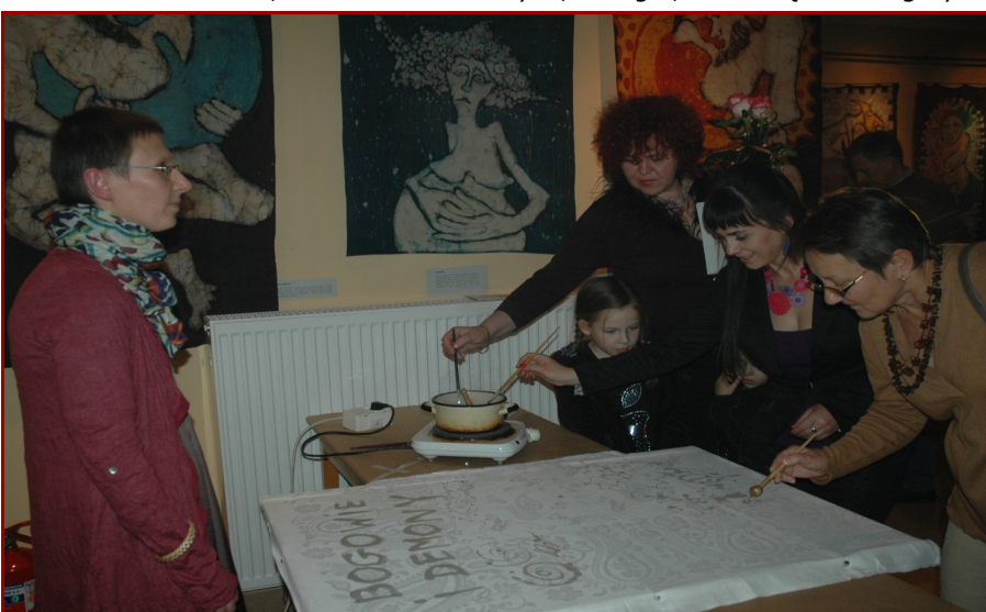
WARSZTATY TECHNIKĄ BATIKU POPROWADZIŁA AUTORKA WYSTAWY