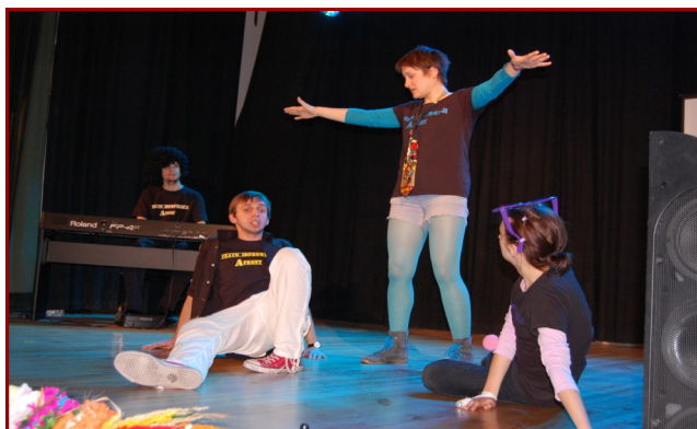
GOŚCIE KOZIENICKIEGO DNIA ŚMIECHU: GRUPA „AFRONT” Z WARSZAWY I PROGRAM IMPROWIZOWANY „RYMEM GO!”

Przypomnijmy, że pomysłodawcą Światowego Dnia Uśmiechu był Harvey Ball - twórca najpopularniejszej emotikonki na świecie - żółtego „Smiley'a” 😊 Obchodzony on jest od 1999 roku.