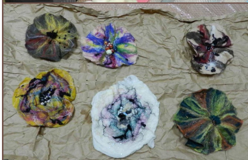
Uczestniczki warsztatów oraz ich prace „Kwiat z filcu” - broszka.