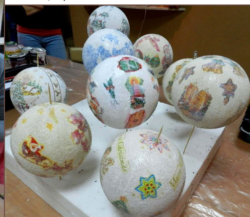
Uczestniczki warsztatów oraz ich prace „Bombka na święta”.