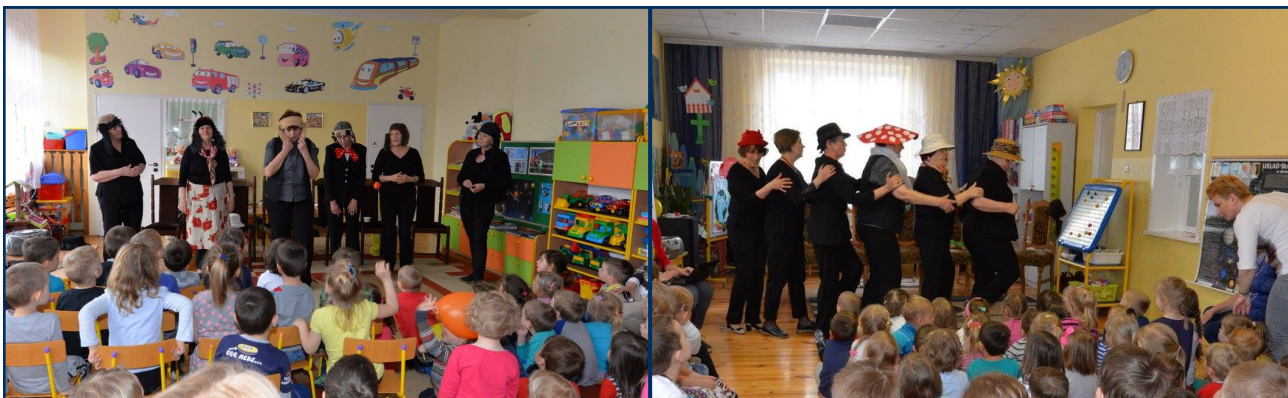
Grupa teatralna została bardzo mile przyjęta przez przedszkolaków zarówno z przedszkola nr 4 (zdjęcie po lewej) oraz z przedszkola nr 5 (zdjęcie po prawej).

Grupa teatralna UTW działająca w Kozienickim Domu Kultury pod okiem aktora Radosława Mazura, przygotowała dla najmłodszych mieszkańców naszej gminy niezwykle spektakl teatralny zatytułowany „Lekarstwo na nudę”.