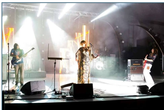
Koncert Ani Rusowicz z zespołem przeniósł wszystkich w klimat szalonych lat 60-tych i 70-tych.