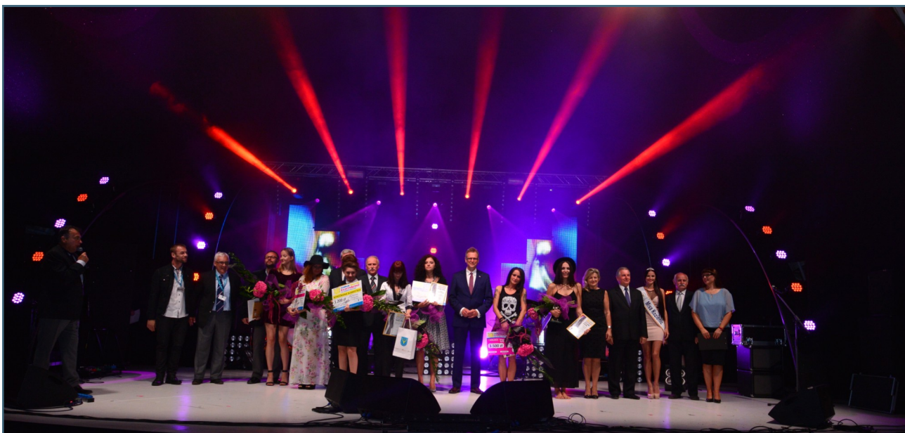
Laureaci tegorocznego konkursu piosenki wraz z patronami, sponsorami i jurorami.

Kolejna edycja Festiwalu Muzyki Rozrywkowej im. Bogusława Klimczuka już za nami. W tym roku, jak i w poprzednich latach, nie obyło się bez Konkursu Piosenki o Nagrodę im. Bogusława Klimczuka oraz wielkich gwiazd polskiej estrady. Nie brakowało również wielkich emocji, dobrego humoru i zabawy.