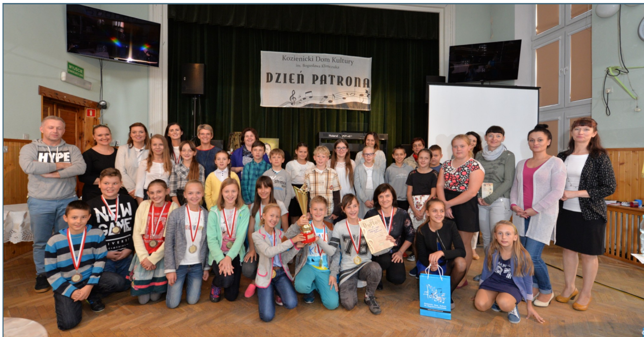
Uczestnicy konkursu wraz z pracownikami Kozienskiego Domu Kultury im. Bogusława Klimczuka.

29 września w Kozienskim Domu Kultury, już po raz czwarty, odbyły się obchody Dnia Patrona. W konkursie o puchar dyrektora KDK udział wzięli uczniowie ze szkół podstawowych gminy Koziensice. Drugi rok z rzędu zwycięzcą okazała się drużyna z PSP nr 3 w Koziensicach, czyli „Szczęściarze II”.