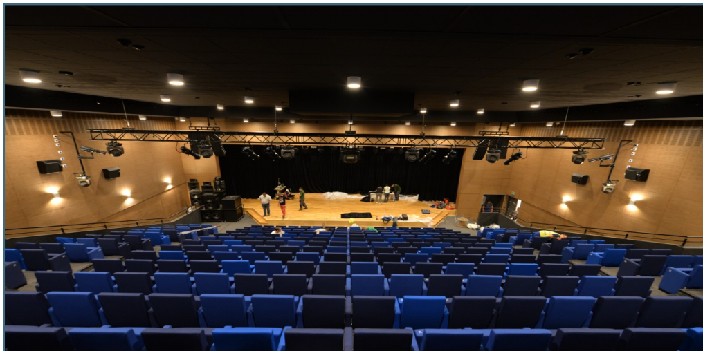
W sali widowiskowo - kinowej znajduje się 356 miejsc.