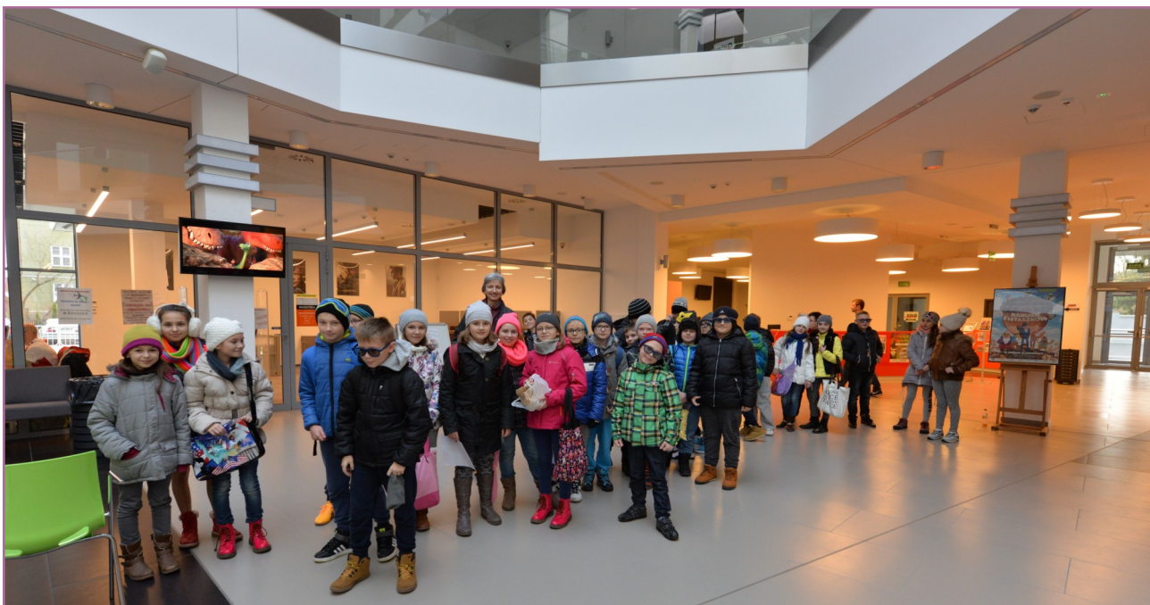
Jako pierwsi z nowej oferty skorzystali uczniowie Publicznej Szkoły Podstawowej nr 3 z Oddziałami Integracyjnymi w Kozienicach.

Od listopada wprowadzono do oferty kina w Kozienicach nowy cykl tj. „Seanse szkolne”, w którym obowiązują preferencyjne ceny biletów. Mogą z niej korzystać placówki oświatowe nie tylko z terenu miasta i gminy Kozienice oraz powiatu kozienickiego, ale również z gmin i powiatów ościennych.