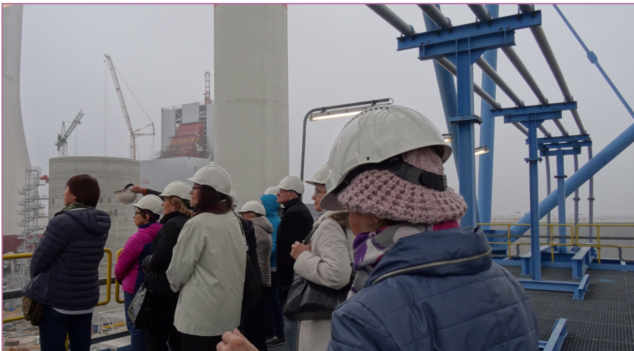
Jednym z punktów wycieczki było oglądanie Elektrowni z poziomu +35,65 m.