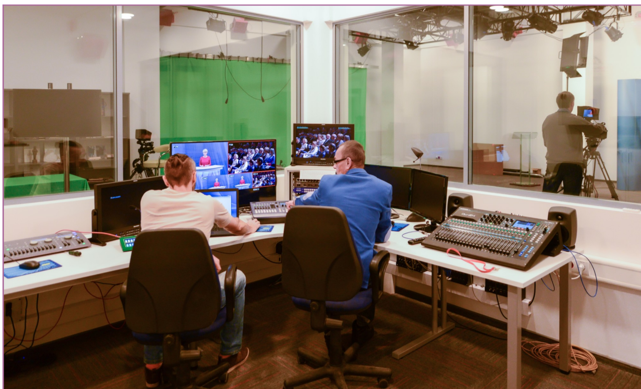
Nowe studio telewizji lokalnej „Kronika Koziensicka” ma prawie 240 m 2 . To tutaj powstają m.in. materiały z bieżących wydarzeń w gminie Koziensice.

Relacje z regionu, najważniejsze wydarzenia kulturalne, sportowe i oświatowe, retransmisje z obrad sesji Rady Miejskiej w Koziensicach, reportaże, programy informacyjne, materiały archiwalne. To wszystko, całkowicie za darmo, na kanale YouTube Kozienskiego Domu Kultury.