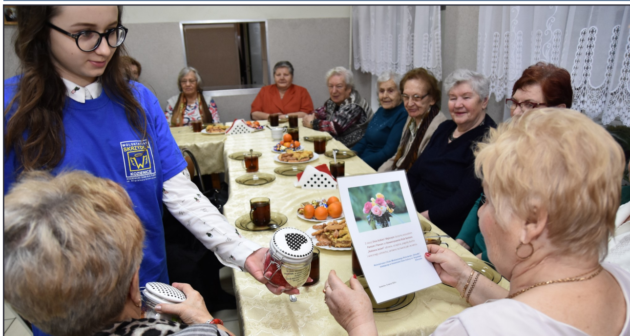
Nasi wolontariusze z Młodzieżowego Klubu Wolontariatu „Skrzydła”, 7 marca, odwiedzili z upominkami członków Stowarzyszenia Klub Seniora „Radosna Jesień” w Kozienicach z okazji Dnia Kobiet i Dnia Mężczyzn.