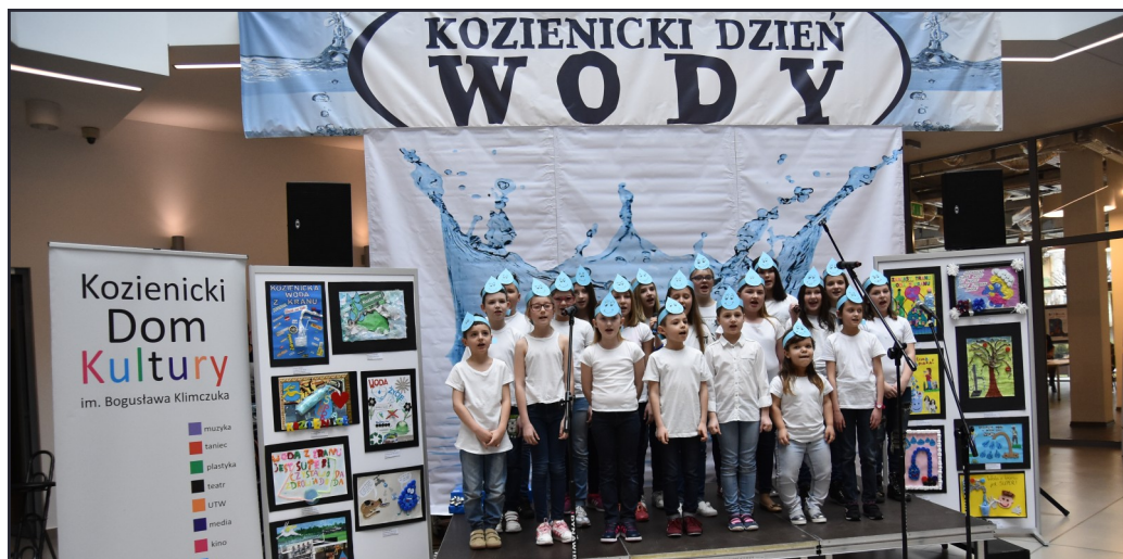
Chór „Mały Gospel” z KDK śpiewał piosenki o tym, jak ważna dla życia jest woda.

Koncert zespołu GlassDuo, wspaniałe konkursy z nagrodami dla dzieci i dorosłych, gry i zabawy, warsztaty, występy wokalne młodych artystów czy prezentacje stoisk Kozienickiej Gospodarki Komunalnej i Kozienickiego Parku Krajobrazowego – to tylko niektóre z atrakcji, jakie miały miejsce podczas IV kozienickich obchodów „Światowego Dnia Wody” w sobotę, 25 marca.