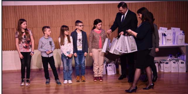
Wszyscy uczestnicy konkursu plastycznego i ich opiekunowie otrzymali upominki z rąk organizatorów.