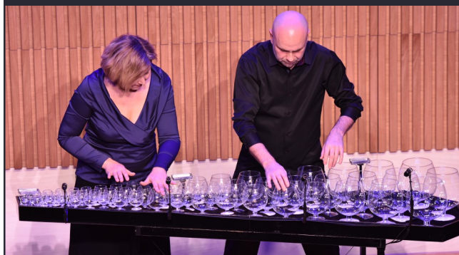
Zespół GlassDuo koncertuje na największej szklanej harfie na świecie! To jedyny taki zespół w Polsce.

Po zakończonym występie zespół otrzymał kwiaty od organizatorów.