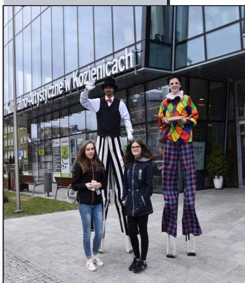
Weseli szczudlarze zachęcali przechodniów do udziału w IV kozienickich obchodach „Światowego Dnia Wody”.