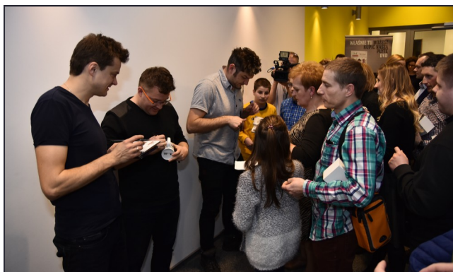
Chętnych na autografy kabareciarzy nie brakowało!