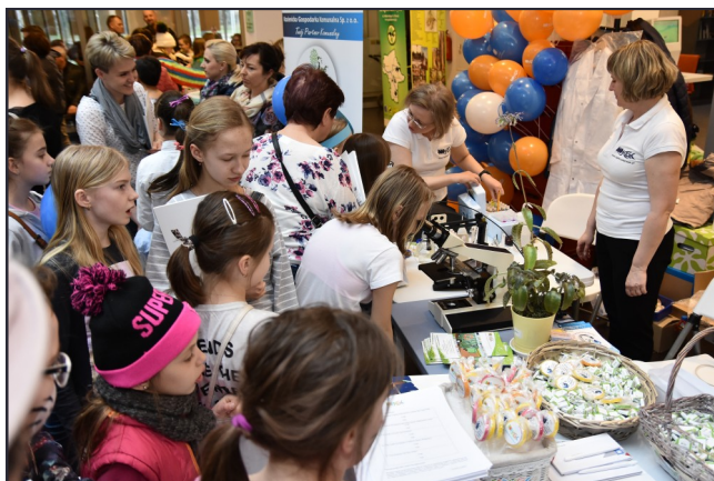
Na stoisku KGK czekały m.in. słodkości, ankiety konkursowe i zestaw małego naukowca.

Zwieńczeniem obchodów był występ zespołu GlassDuo, grającego na szklanej harfie, czyli instrumencie zbudowanym z 57 specjalnych kieliszków. Jego skala sięga 5 oktaw! Zespołowi towarzyszył kwartet smyczkowy Primo Incorto, a razem zegrali klasyki muzyki poważnej. Widzowie zebrani w sali kameralnej CKA dosłownie zanurzyli się w dźwiękach anielskiego instrumentu.