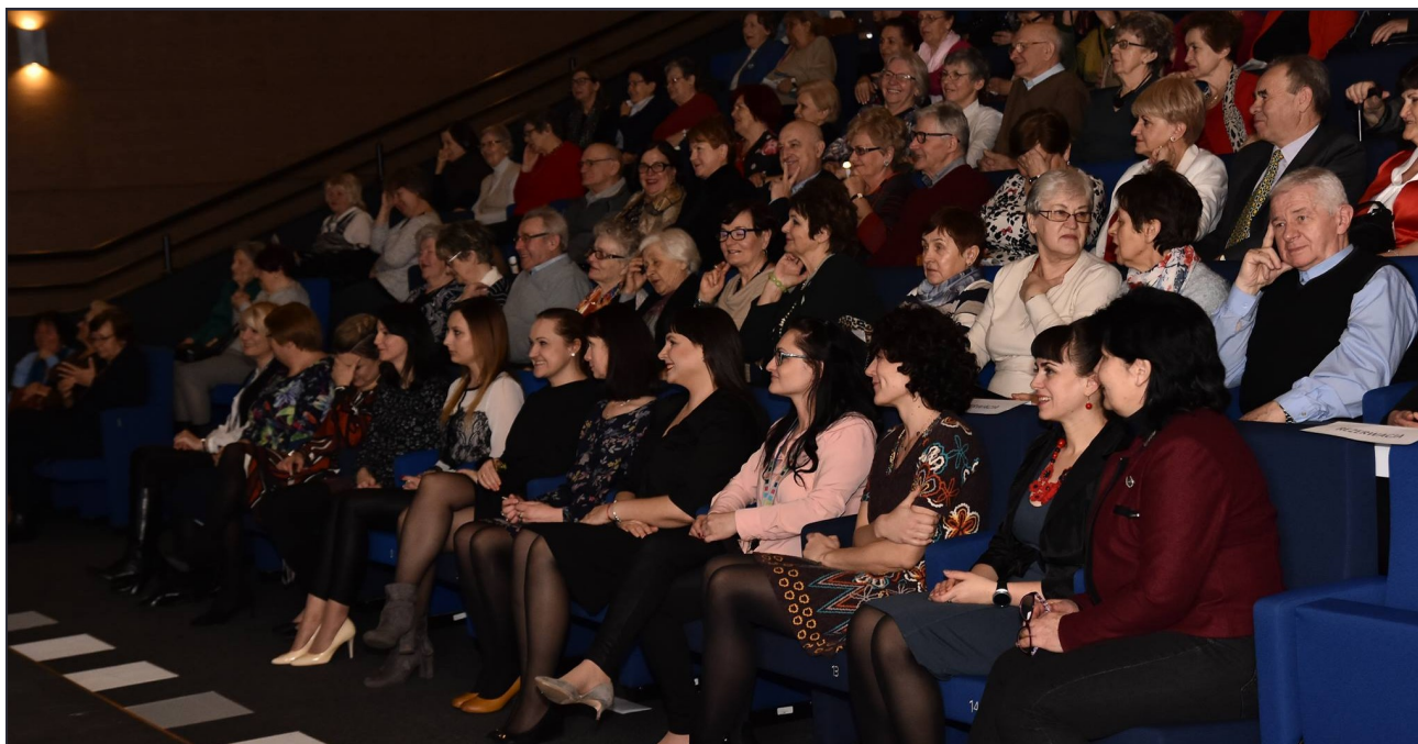
Na spotkanie panowie z UTW zaprosili również dyrektor oraz pracowników Kozienickiego Domu Kultury.

W środę, 8 marca, Uniwersytet Trzeciego Wieku opanowała moc życzeń, a cotygodniowe spotkanie słuchaczy było dobrą okazją do przypomnienia historii Dnia Kobiet. Były życzenia dla pań, jak również panów, z okazji zbliżającego się Dnia Mężczyzn.