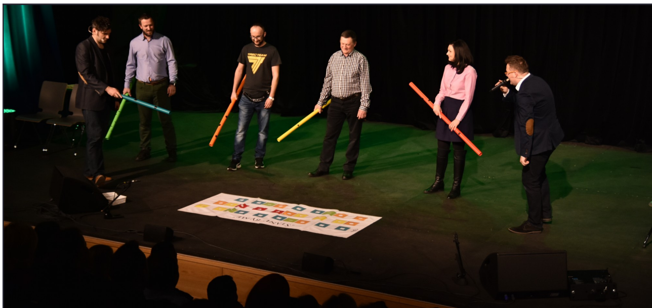
„Zespół Tuba”, czyli Kabaret Smile i kozienicka widownia w utworze „Stand by me”.

W czwartek, 23 marca, w Centrum Kulturalno-Artystycznym dwukrotnie wystąpił Kabaret Smile. Lubelska formacja jest znana z wielu programów telewizyjnych, a swoją klasę w pełni udowodniła rozbawiając kozienicką publiczność do łez!