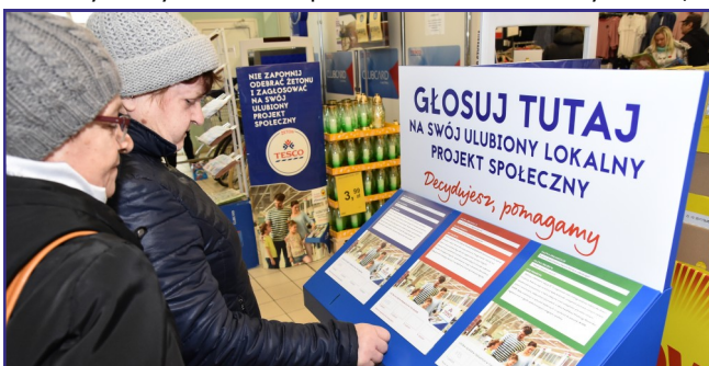
Wygraliśmy dzięki Waszym głosom, oddanym podczas zakupów w sklepach TESCO. Dziękujemy i zapraszamy do udziału w akcji. Razem zrobimy coś wyjątkowego!

Organizatorem przedsięwzięcia jest grupa Foto-Kreatywni z Kozienska przy współpracy z Kozienskim Domem Kultury im. Bogusława Klimczuka. Projekt dofinansowany jest z programu „Decydujesz, pomagamy”.