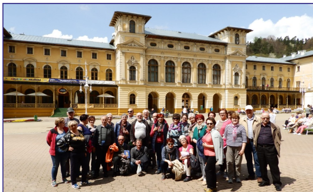
Uczestnicy wyjazdu przed zabytkowym Domem Zdrojowym w stylu eklektycznym.