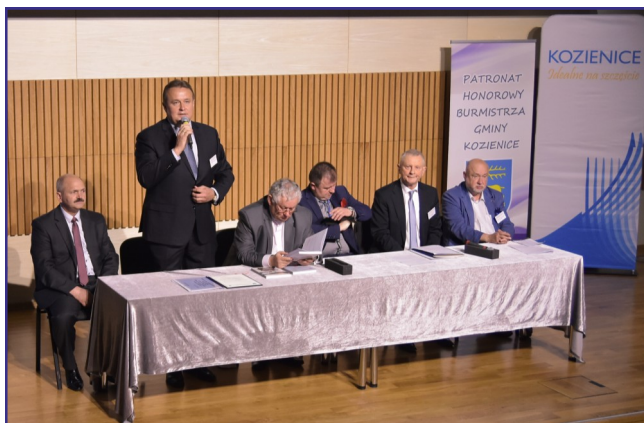
Nad przebiegiem konferencji czuwał Komitet Naukowy złożony z wykładowców uniwersyteckich.