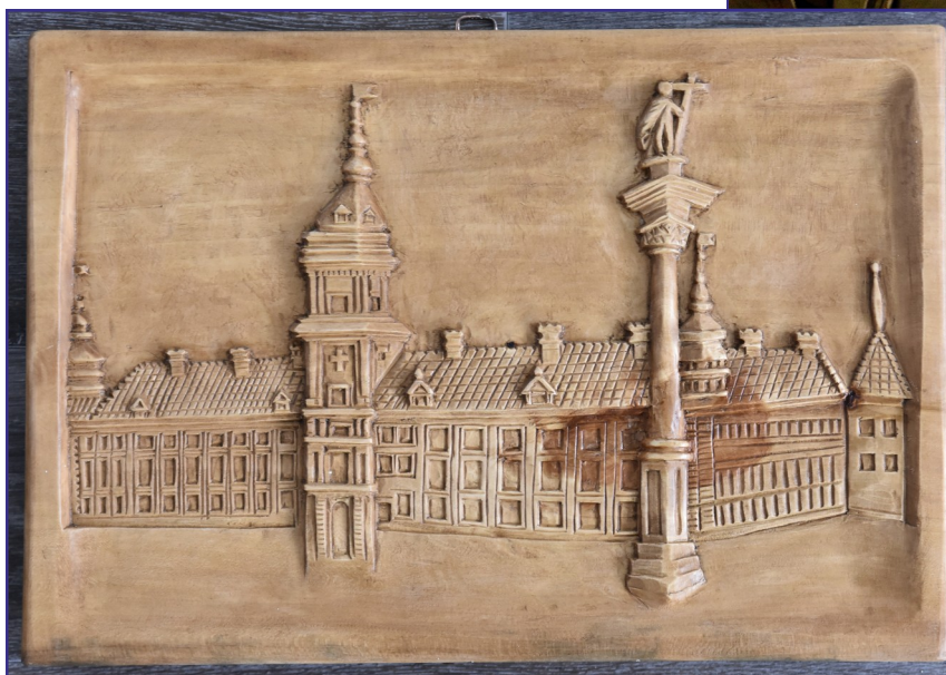
Powyżej płaskorzeźba ukazująca Zamek Królewski w Warszawie z Kolumną Zygmunta, po prawej przykład twórczości sakralnej.