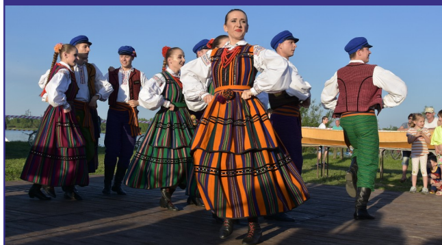
Zespół „Jawor” zaprezentował szereg tradycyjnych tańców i melodii, głównie związanych z Powiślem. Nie obyło się też bez wspólnej potańcówki!