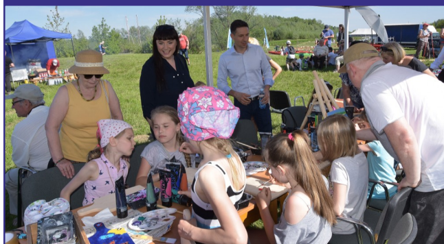
Artyści z GT VENA przeprowadzili warsztaty plastyczne z najmłodszymi uczestnikami pikniku nad Wisłą.