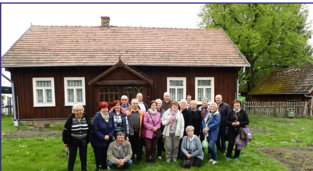
Słuchacze odwiedzili m.in. dom Wincentego Witosa w Wierchosławicach.

W drugim dniu naszej wycieczki, jadąc Doliną Popradu, podziwialiśmy Popradzki Park Krajoznawczy w dolinie Beskidu Sądeckiego, która oddziela od siebie dwa jego główne pasma: Pasma Radziejowej i Pasma Jaworzyny. Zwiedziliśmy unikalną drewnianą