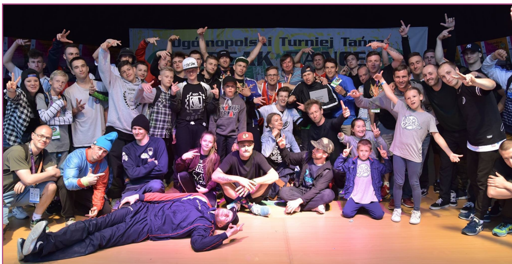
W tym roku IV Ogólnopolski Turniej Tańca Break Dance „Kozienice City Breakers” przyciągnął rekordową liczbę uczestników.

Za nami czwarta odsłona breakdance'owych zmagañ. W tym roku na parkiecie rywalizowała rekordowa liczba uczestników. 10 czerwca w kozienickim amfiteatrze zmierzyło się ponad stu tancerzy z całego kraju. Imprezę zakończył występ legendarnego zespołu Kaliber 44.