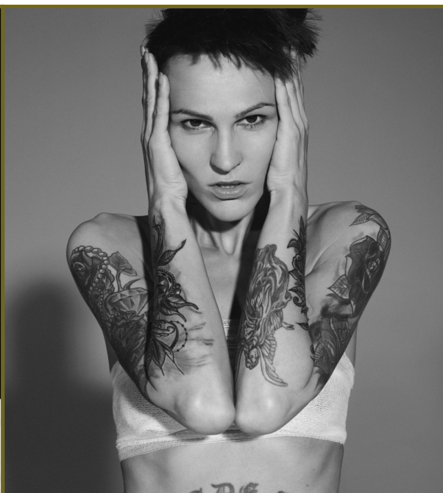
Gwiazdami tegorocznego jubileuszowego festiwalu będą: Cezary Pazura i Agnieszka Chylińska z zespołem.