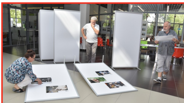
Jury, spośród nadesłanych na konkurs prac, wyłoniło trzydzieści najlepszych. Teraz o zwycięzcach to Państwo będą decydować.

Projekt został dofinansowany z programu „Decydujesz, pomagamy” realizowanego we współpracy z siecią sklepów TESCO i Fundacją „Stocznia”.