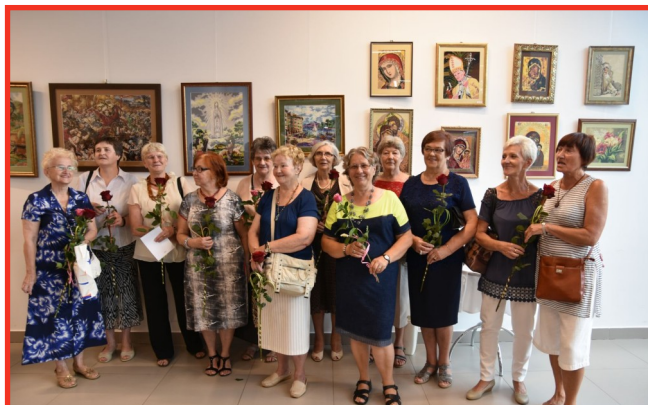
Członkinie Klubu „Niteczka”.

w dorobku klubowiczek, jest też pewnego rodzaju podsumowaniem siedmioletniej działalności „Niteczki”.