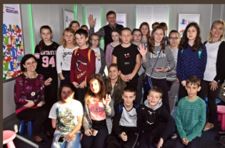
Polskie Radio Dzieciom.