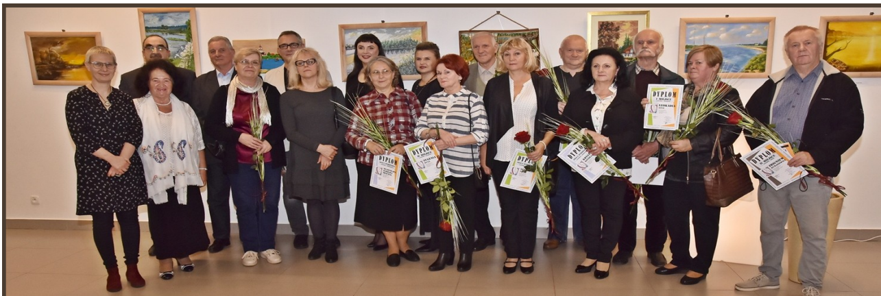
Artyści z Grupy Twórczej VENA działającej w Kozienickim Domu Kultury im. Bogusława Klimczuka odebrali pamiątkowe dyplomy oraz nagrody i wyróżnienia przyznane przez jury.

W piątek, 13 października w Centrum Kulturalno-Artystycznym w Kozienicach odbyło się spotkanie pokonkursowe, działającej od 20 lat w Kozienickim Domu Kultury im. Bogusława Klimczuka, Grupy Twórczej VENA, na którym ogłoszone zostały wyniki IV konkursu artystycznego. Udział w nim wzięło 11 członków grupy.