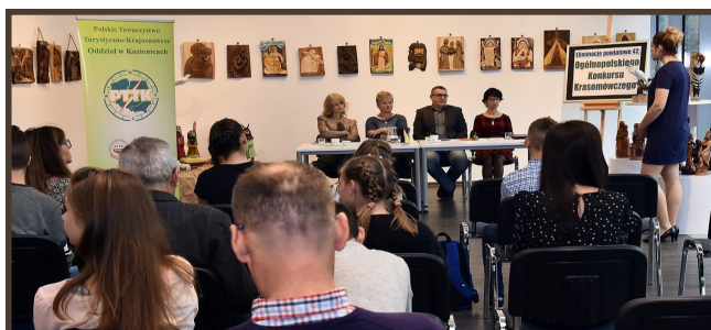
W eliminacjach udział wzięło 15 krasomówców z całego Powiatu Kozienickiego.