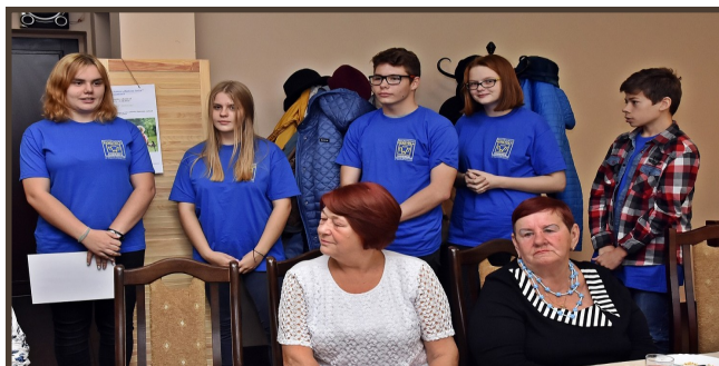
Wolontariusze KDK złożyli Seniorom życzenia.

- Będąc tu z Wami czuję się swojsko, bo moja mama jest w podobnym wieku, a mama to zawsze osoba najbliższa sercu. Widząc uśmiech na Waszych twarzach chciałbym, abyście byli impulsem dla tych Seniorów, którzy siedzą w domach i nie chcą z nich wyjść, są trochę zagubieni, smutni, samotni i mają utrudniony kontakt z bliskimi. Pokażcie im, że przeżywanie jesieni życia we wspólnocie jest radosne i kolorowe, że jesień może być bardziej kolorowa od lata, bo dojrzały człowiek potrafi cieszyć się życiem bardziej kompleksowo niż młodzi, którzy cały czas za czymś gonią, najpierw za miłością, później za pracą, pieniędzmi, rozwojem i tak ich to