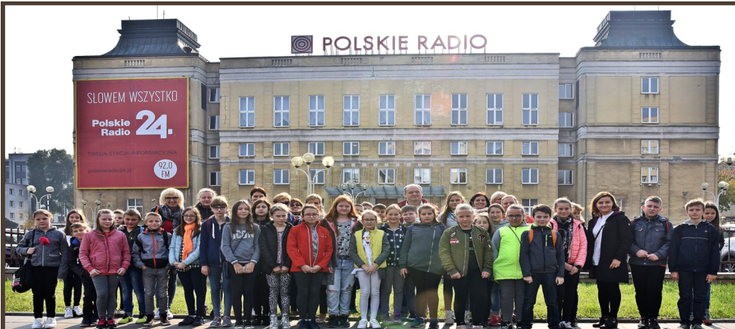
Piątoklasiści z 11 szkół wzięli udział w wycieczce z okazji „Dnia Patrona”.