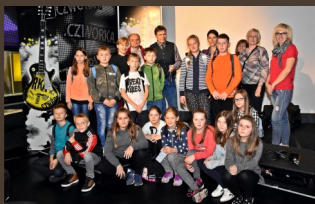
W radiowej „czwórce”.