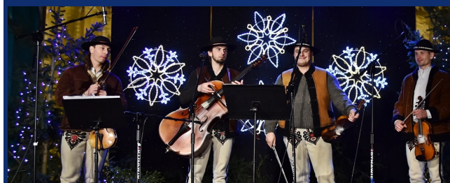
Zespół Góralska Hora.