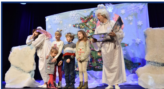
Dzieci chętnie śpiewały kolędy z Gapiem i Gapcią, w oczekiwaniu na wigilijną gwiazdę i św. Mikołaja.

W rolę Mikołaja i aniołków wcielili się aktorzy z Teatru WARIACJA z Warszawy. Na obu spektaklach, na które obowiązywały darmowe wejściówki, sala była pełna, a widzowie wracali do domów z uśmiechami.