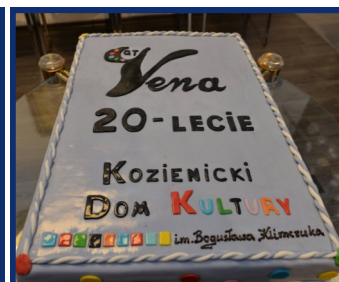
Na gości czekał jubileuszowy tort.