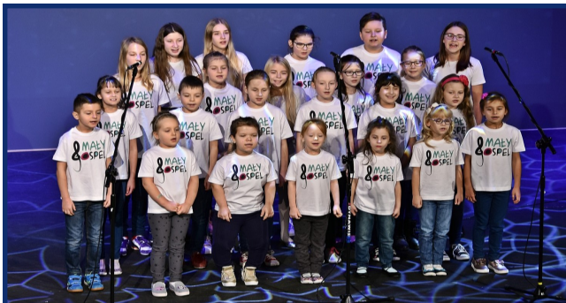
„Mały Gospel” z KDK zaśpiewał „Dzisiaj w Betlejem”.

Jak co roku Kozienski Dom Kultury im. Bogusława Klimczuka zorganizował Konkurs Kolęd i Pastorałek „Na ten Nowy Rok”. Dziewiąta edycja konkursu została połączona z eliminacjami do XVI Ogólnopolskiego Festiwalu Kolęd i Pastorałek „Staropolskie Kolędowanie” Radom 2017. Przesłuchania odbyły się 7 grudnia, w sali koncertowo-kinowej Centrum Kulturalno-Artystycznego w Kozienicach. Zgłosiło się na nie 54 uczestników z terenu powiatu kozienskiego: soliści, duety, zespoły i chóry.