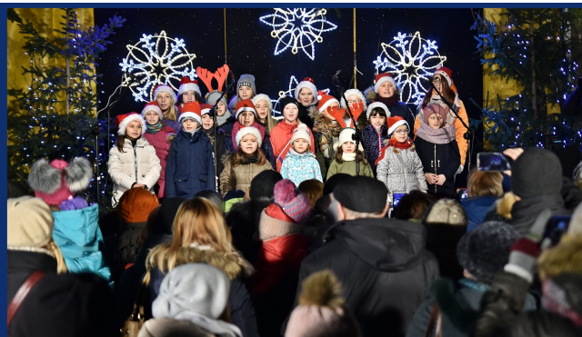
Na wigilijnej scenie wystąpili laureaci IX Konkursu Kolęd i Pastorałek „Na ten Nowy Rok” m.in. chór Mały Gospel z KDK.