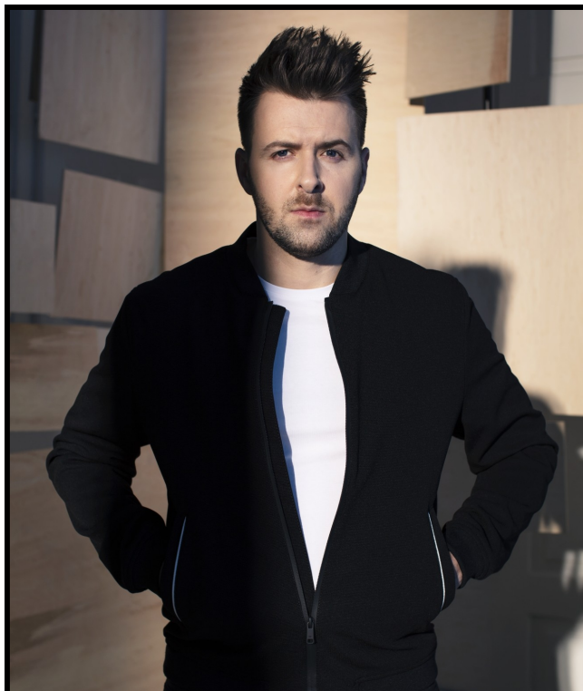
Gwiazdą tegorocznej edycji Festiwalu Muzyki Rozrywkowej będzie Grzegorz Hyży.

Na finał festiwalu wystąpi natomiast Grzegorz Hyży. Popularny wokalista był finalistą trzeciej edycji programu X Factor. Na swoim koncie ma dwie bestsellerowe płyty i takie hity, jak: „Wstaję”, „Na chwilę”, „Pod wiatr”, „O Pani!” czy „Podatek od miłości”. Jego fanpage na portalu