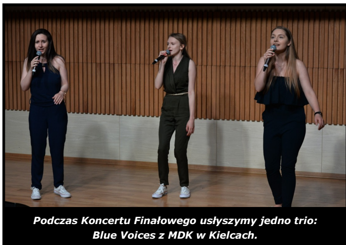
Podczas Koncertu Finałowego usłyszymy jedno trio: Blue Voices z MDK w Kielcach.

BLUE VOICES (Młodzieżowy Dom Kultury w Kielcach), w utworach: „Cykady na Cykladach” z repertuaru zespołu Maanam, sł. i muz. Marek Jackowski i „Płynie w nas gorąca krew” z repertuaru zespołu Bajm, sł. Beata Kozidrak, muz. Jarosław Kozidrak.