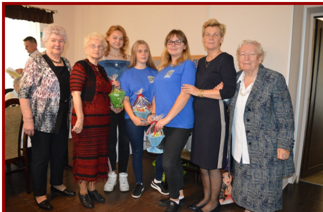
Okazją do kolejnego spotkania z seniorami z „Radosnej Jesieni” był Dzień Seniora.

Natomiast w środę, 31 października, zakończyła się kolejna akcja zbiórki plastikowych nakrętek, którym to regularnie patronuje klub „Skrzydła”.