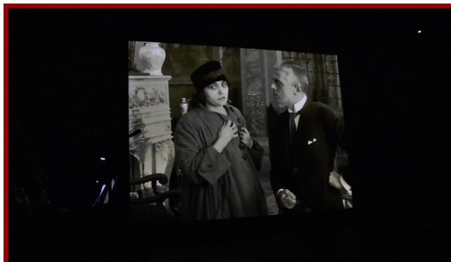
„Mania. Historia pracownicy fabryki papierosów” - wyjątkowa produkcja z wyjątkową oprawą.

Aktualne informacje o Kinie KDK można znaleźć na stronie www.kinokozienice.pl