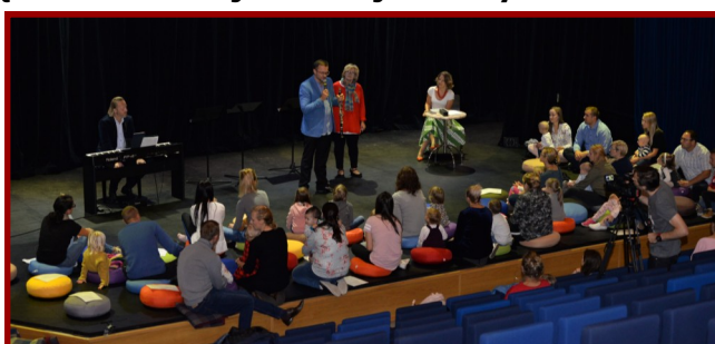
„Smykofonia” to świetna opcja dla maluszków!

Serdecznie zapraszamy wszystkich rodziców z małymi dziećmi. Kolejny koncert z tego cyklu odbędzie się już 18 listopada. Początek o godz. 13.00 w sali koncertowo-kinowej CKA.