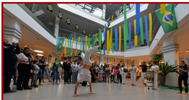
Pokazy, spotkania, warsztaty... Działo się dużo!

Tego dnia był też pokaz brazylijskiej sztuki walki capoeira w wykonaniu „Centrum Capoeira Radom”. Był również wykład i warsztaty dla tych, którzy chcieliby zacząć swoją przygodę z capoeirą. W dalszej części spotkania nie zabrakło degustacji brazylijskich potraw oraz szeregu innych atrakcji skierowanych do najmłodszych, m.in. brokatowe tatuaże i quiz wiedzy o Brazylii z nagrodami.