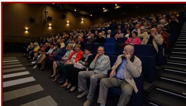
Zajęcia UTW cieszą się dużym zainteresowaniem. Frekwencja na wykładach i fakultetach dopisuje.

Uniwersytet Trzeciego Wieku Kozienickiego Domu Kultury ma nową Radę Słuchaczy. Poprzednia rada była łącznikiem pomiędzy słuchaczami, a dyrekcją