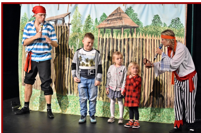
„Poranki teatralne dla dzieci” to świetna zabawa dla młodych widzów, którzy mogą pojawić się na scenie.

Ponadto w przekazanej przez aktorów treści znalazły się m.in. odniesienia do zdrowego stylu życia i odżywiania. Były też zmieniające się kurtyny imitujące różne przestrzenie od tawerny przez statek aż po osadę na bezludnej wyspie.