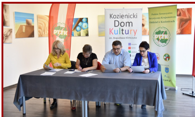
Występy poszczególnych uczestników oceniała specjalnie powołana komisja konkursowa.