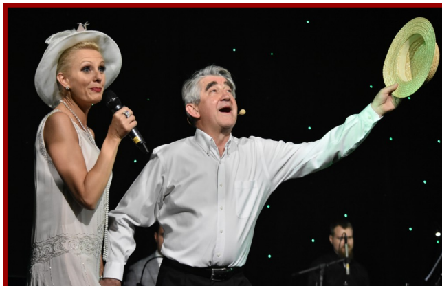
Artyści zabrali widownię w muzyczną podróż przez stulecie polskiej niepodległości.