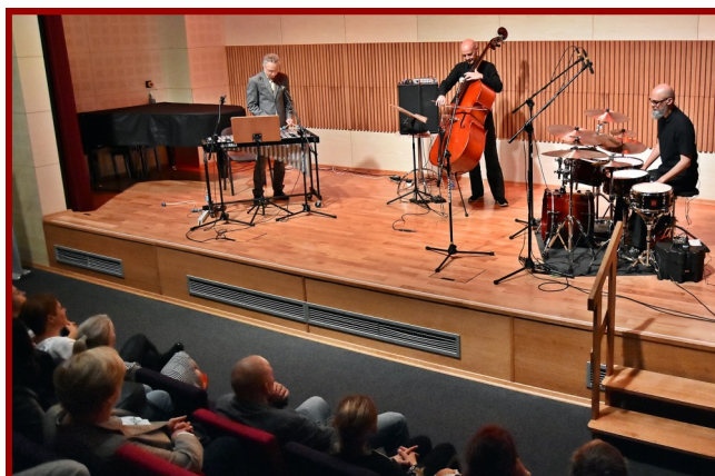
Po raz kolejny koziensczanie mieli okazję posłuchać jazzu na najwyższym poziomie.

„Górecki Ahead” to już drugi projekt zespołu w tym składzie. Pracują razem od 2011 roku i mają wspólne plany na przyszłość, bo jak mówią, dobrze im się razem gra.