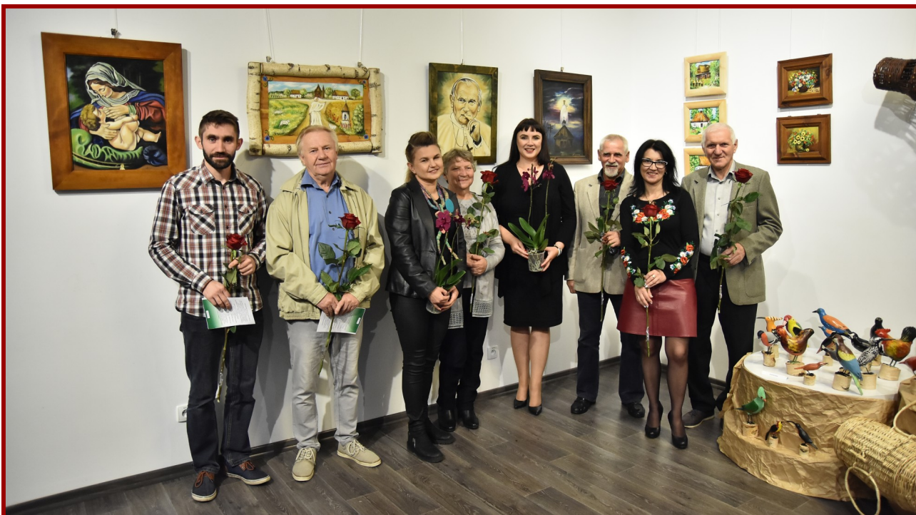
Najnowsza wystawa to efekt współpracy Kozienickiego Domu Kultury i Stowarzyszenia Twórców Ludowych.

Wyjątkowe prace autorstwa członków Stowarzyszenia Twórców Ludowych z okręgu radomskiego można od piątku, 26 października, oglądać w sali wystawowej Centrum Kulturalno-Artystycznego. Grupa obchodzi w tym roku jubileusz 50-lecia działalności i jest to doskonała okazja, aby zaprezentować swoje prace w Kozienicach.