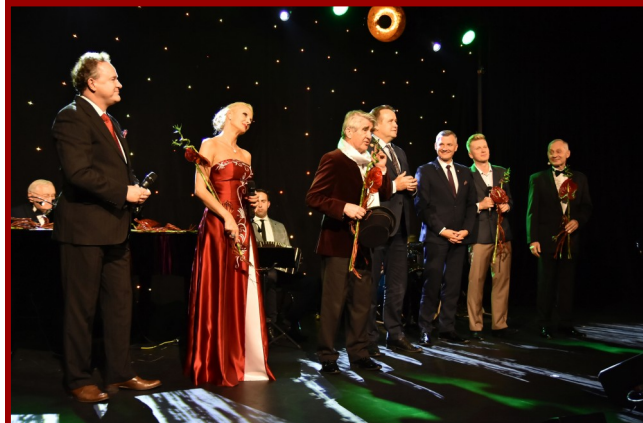
Już po podziękowaniach od organizatorów, artyści zaprosili wszystkich do wspólnego śpiewania.