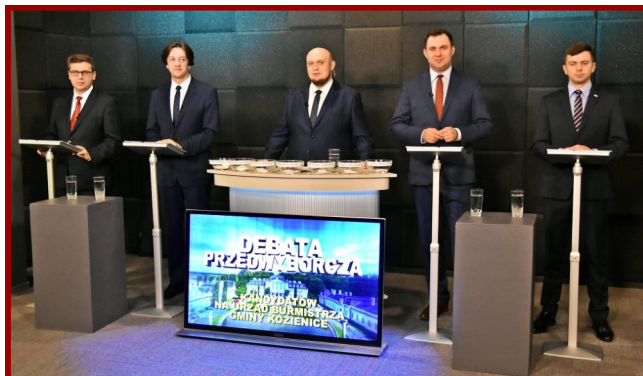
Takiej debaty w Koziensicach jeszcze nie było!

Była to pierwsza tego typu debata w historii Koziensic, a jej organizacja stanowiła nie lada wyzwanie. Program był transmitowany „na żywo” zarówno w telewizji kablowej, jak i (testowo) na naszym kanale YouTube oraz fanpage’u na portalu Facebook.