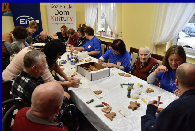
Warsztaty dekorowania pierniczków były dobrą okazją do integracji.

Tydzień później członkowie Młodzieżowego Klubu Wolontariatu „Skrzydła” razem z Wolontariatem Seniora oraz Wolontariatem Pracowniczym Enei