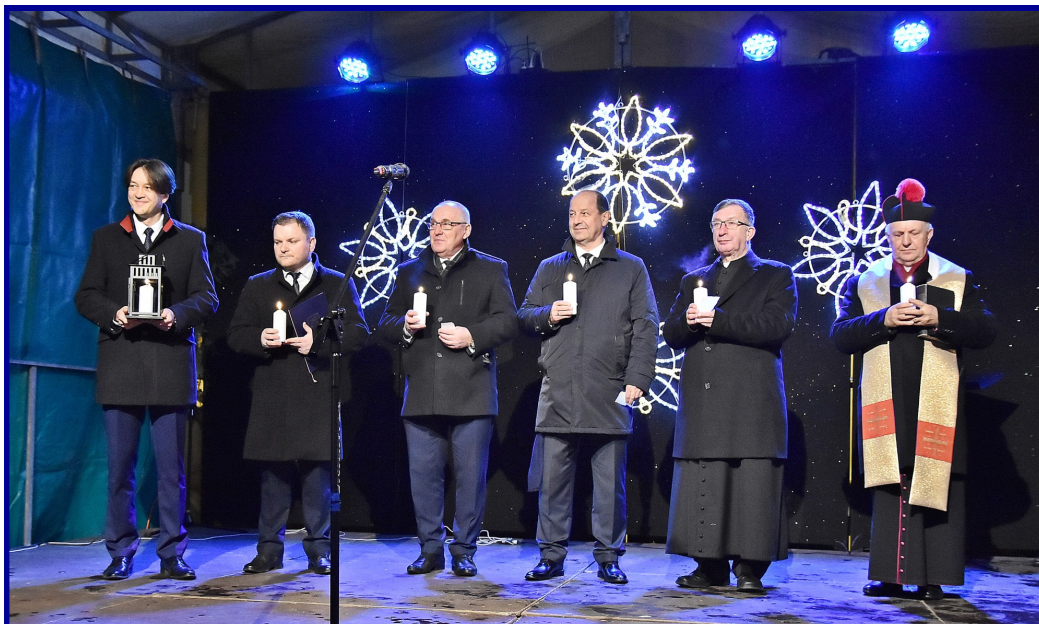
Najlepsze życzenia mieszkańcom złożyli przedstawiciele władz samorządowych, Enei Wytwarzanie, a także proboszczowie obu kozienskich parafii.

Jak co roku, przed krytą pływalnią „Delfin”, odbyło się Spotkanie Wigilijne Mieszkańców Ziemi Kozienskiej. W piątek, 14 grudnia, już po raz dziesiąty setki osób wspólnie przeżywało ten przedświąteczny czas. Była to okazja do integracji, złożenia sobie nawzajem życzeń, nabycia pięknych ozdób i posłuchania kolęd w wyjątkowym wykonaniu. Za część artystyczną wydarzenia odpowiadał Kozienski Dom Kultury.