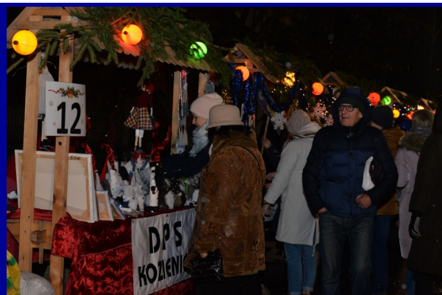
Na kolorowych straganach czekały wyjątkowe, własnoręcznie robione ozdoby świąteczne.