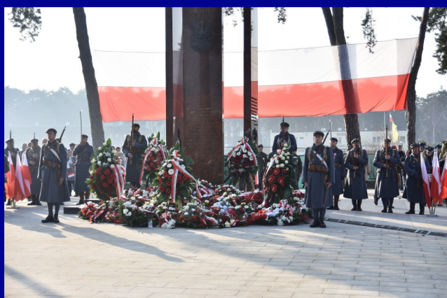
Odsłonięcie Pomnika Niepodległości w Kozienskich.