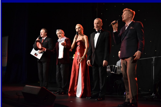
Koncert „Mazowsze w Sercu Niepodległej” w CKA.