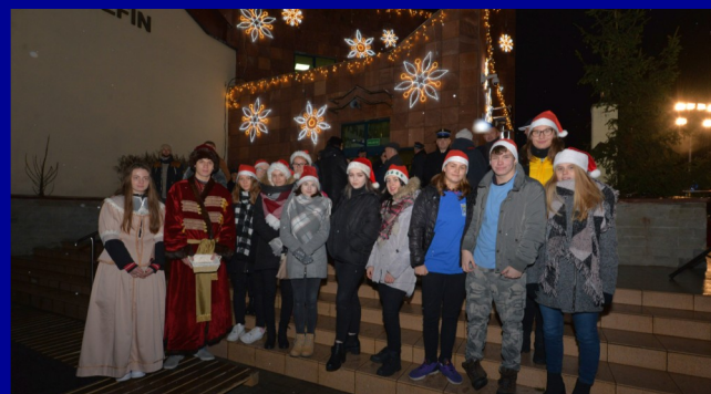
W organizację chętnie włączyli się wolontariusze.