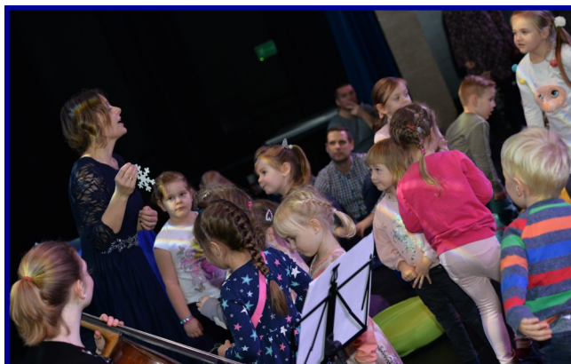
„Smykofonia” to świetna zabawa dla maluchów.

Nie zabrakło także kompozycji Mozarta i Boccheriniego. Maluchom zaprezentowane zostały również poszczególne instrumenty, na których grano. Była mowa o skrzypcach, wiolonczeli i dzwoneczkach. Koncerty „Smykofonii” przeznaczone są dla dzieci do piątego roku życia.