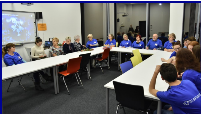
Pomagać można w każdym wieku. U nas działają zarówno wolontariat młodzieżowy, jak i seniora.

To był aktywny miesiąc dla obu naszych grup wolontariatu. Okres świąteczny to świetna okazja do tego, by odwiedzić zaprzyjaźnione organizacje, a także podsumować działalność. Tym bardziej, że w grudniu przypadał Międzynarodowy Dzień Wolontariusza.