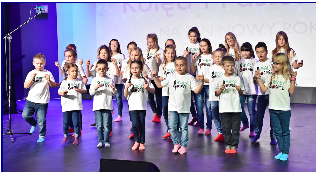
Gospodarzy, czyli Koziennicki Dom Kultury im. Bogusława Klimczuka, reprezentował m.in. chór „Mały Gospel”, który wywalczył I miejsce w swojej kategorii konkursowej.

Za nami X Konkurs Kolęd i Pastorałek „Na Ten Nowy Rok”, który od lat organizowany jest przez Koziennicki Dom Kultury im. Bogusława Klimczuka. W czwartek, 6 grudnia, na scenie sali koncertowo-kinowej Centrum Kulturalno-Artystycznego wystąpiło łącznie 52 uczestników, w tym chóry, zespoły, duety i soliści, w wieku od 6 do 19 lat.