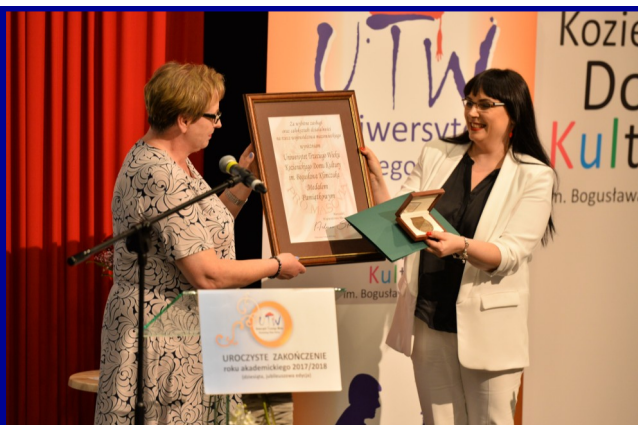
Zakończenie X edycji Uniwersytetu Trzeciego Wieku.