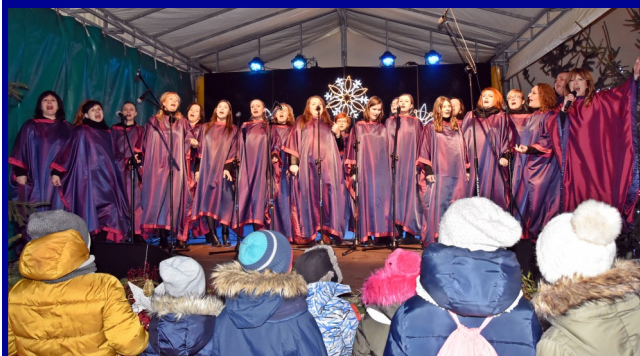
Gościem spotkania był zespół Gospel z Radomia.