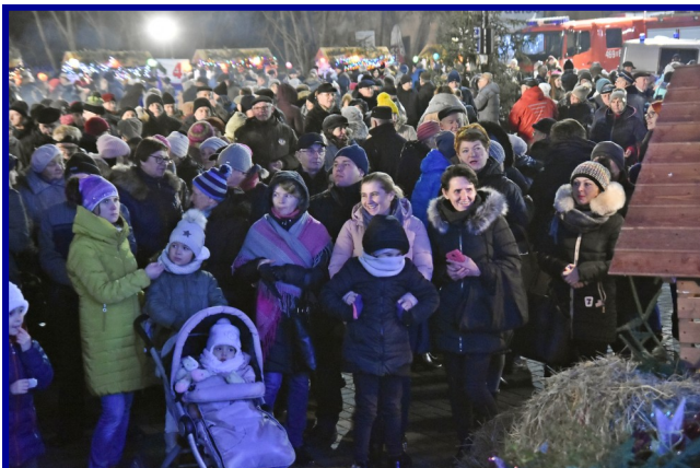
Jak co roku, przed pływalnią „Delfin” zgromadziły się setki mieszkańców Ziemi Kozienskiej.

W organizację świątecznego spotkania zaangażowanych było blisko 40 instytucji i organizacji. W tym m.in. Kozienski Dom Kultury im. Bogusława Klimczuka. Więcej zdjęć z tego wydarzenia można znaleźć na naszym fanpage'u na portalu Facebook, a relację wideo na kanale YouTube.