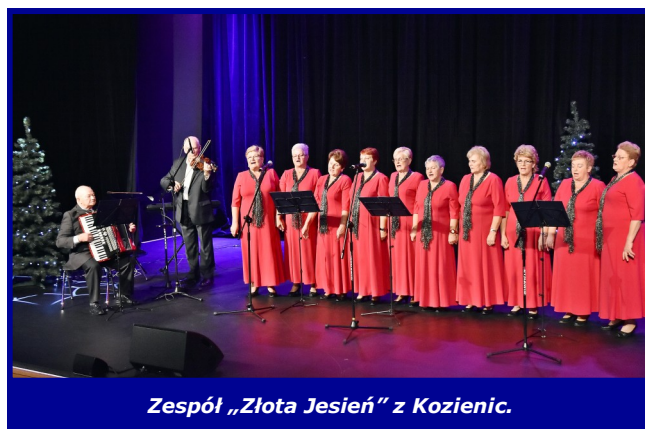
Zespół „Złota Jesień” z Kozienic.