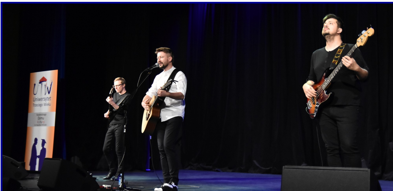
Do Kozienska „Piramidy” przyjechały w trzyosobowym składzie, by zabrać słuchaczy w muzyczną podróż.

To było wyjątkowe spotkanie Uniwersytetu Trzeciego Wieku Kozienskiego Domu Kultury. W środę, 5 grudnia, dla naszych słuchaczy wystąpił zespół „Piramidy” z programem „Bułat Okudźawa – najpiękniejsze pieśni i ballady”.