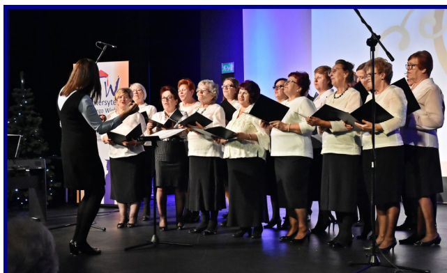
Tradycyjnie z kolędami wystąpił Chór UTW.

Było to spotkanie wigilijne, więc nie mogło zabraknąć również dzielenia się opłatkiem. Po części oficjalnej zaproszeni goście oraz słuchacze UTW przenieśli się piętro niżej, do patio Centrum Kulturalno-Artystycznego, gdzie czekał na nich poczęstunek. Tutaj nastąpił też dalszy ciąg składania życzeń i dzielenia się opłatkiem.