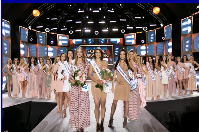
Półfinał konkursu Miss Polski 2018.