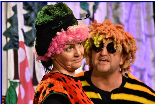
Biedronka bawiła i uczyła najmłodszą widownię.

W czasie spektaklu aktorzy przekazywali młodej publiczności wiedzę i niejednokrotnie sprawdzali, co dzieci już zapamiętały. Była to świetna, edukacyjna zabawa dla małych dam i gentlemanów.