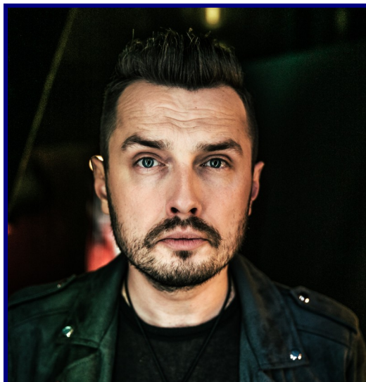
Piotr Cugowski w ostatnim czasie stawia na karierę solową.