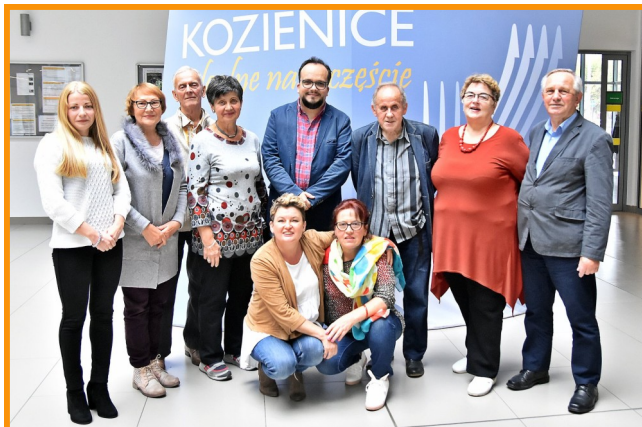
Uczestnicy warsztatów wraz z prowadzącym.

Jak przyznał krytyk, uczestnicy spotkania prezentowali zróżnicowany poziom artystyczny, ale w jego ocenie nie to jest najważniejsze.