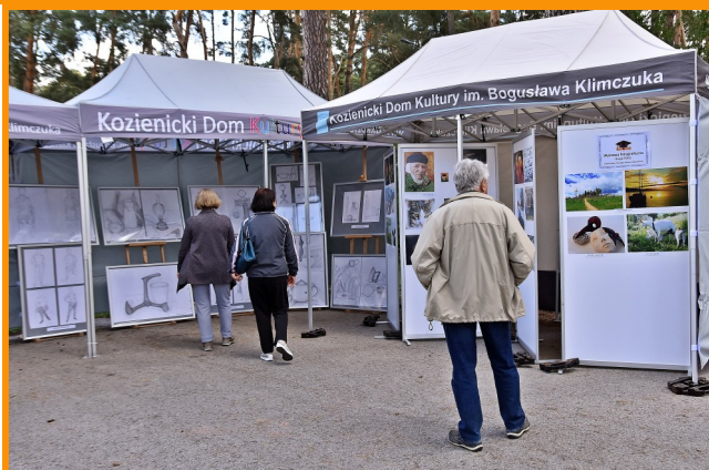
Swoje prace na pikniku zaprezentowali artyści z grup fakultatywnych UTW. Wszyscy chętni mogli zobaczyć ich rysunki oraz fotografie.

Dla uczestników pikniku przygotowano również „Miasteczko zdrowego seniora”. Tam między innymi