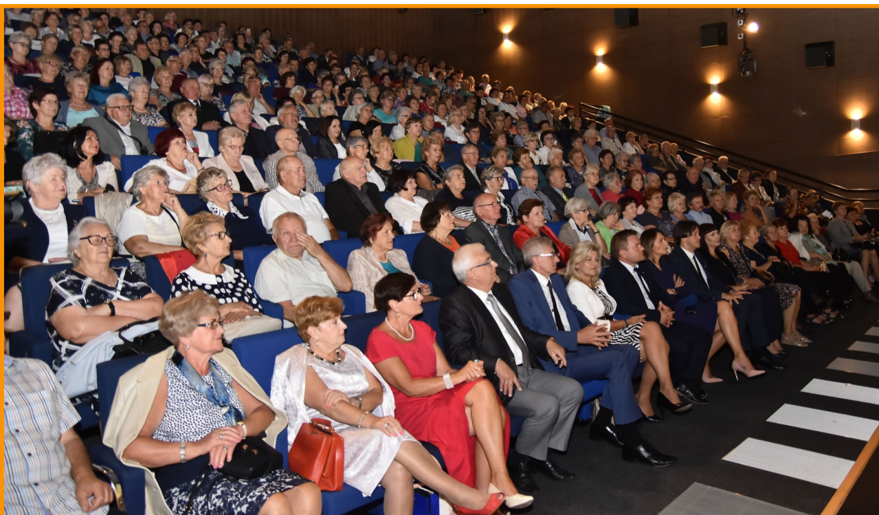
Na uroczystej inauguracji roku akademickiego 2019/2020 pojawiły się setki osób. Sala wypełniła się po brzegi.

610 osób znalazło się na liście słuchaczy Uniwersytetu Trzeciego Wieku Kozienickiego Domu Kultury w roku akademickim 2019/2020. Już po raz kolejny pobity został zatem rekord frekwencji, co bardzo nas cieszy. Zainteresowanie tą ofertą KDK dla seniorów stale rośnie, a 11 września mieliśmy okazję powitać setki naszych studentów podczas oficjalnej inauguracji dwunastej już edycji uniwersytetu.