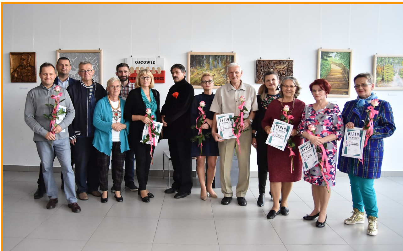
Uczestnicy, organizatorzy oraz członkowie jury tegorocznej edycji konkursu artystycznego.

W piątek, 27 września, w sali na rogu Centrum Kulturalno-Artystycznego dokonano uroczystego otwarcia pokonkursowej wystawy Grupy Twórczej „Vena”. W trakcie wernisażu ogłoszono wyniki konkursu artystycznego i wręczono nagrody zwycięzcom.