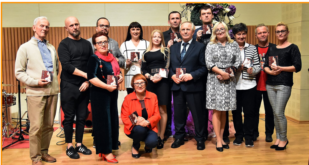
Organizatorzy wydarzenia, poeci z grup „Erato” i „Tygiel” oraz członkowie zespołu „Zmiana Czasu”.

W niedzielę, 29 września, w Kozienickim Domu Kultury im. Bogusława Klimczuka odbyła się promocja audiobooka „Erato”. To nagrany na płycie CD tomik wierszy poetów z Grupy Poetyckiej „Erato”, działającej w KDK oraz Grupy Literackiej „Tygiel”, funkcjonującej przy Stowarzyszeniu Centrum Młodzieży „Arka” w Radomiu. Płyta została nagrana w kwietniu w „Radomskiej Szkole Rocka”, o czym informowaliśmy na naszych łamach.