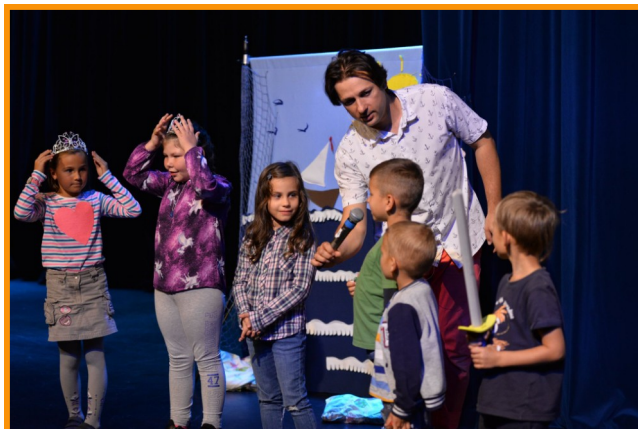
To była wspaniała, interaktywna zabawa.

Inspiracją do stworzenia scenariusza tego przedstawienia były dwie baśni braci Grimm: „O rybaku i jego żonie” oraz „Złote dzieci”.