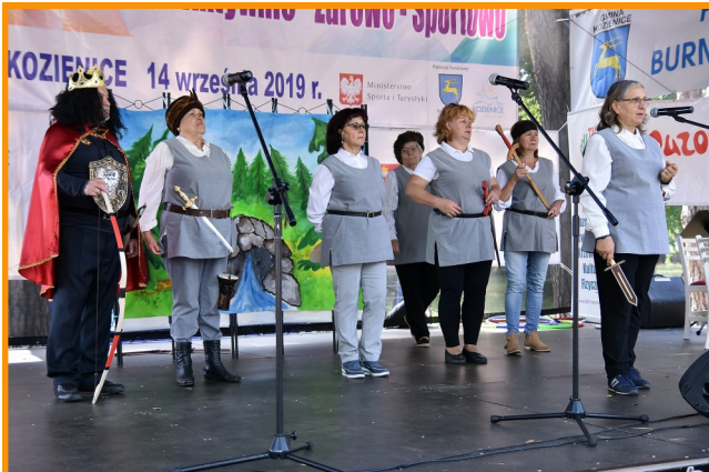
Wolontariusze-seniorzy wystawili „Kozienicką Baśń” na podstawie tekstu Dariusza Szewca.

Okolo 800 osób wzięło udział w kolejnej edycji pikniku „Mazowsze Seniorom. Aktywnie – Zdrowo – Sportowo”, który odbył się w sobotę, 14 września, na terenie Ośrodka Rekreacji i Turystyki KCRiS nad jeziorem. W grupie uczestników było okolo 200 słuchaczy Uniwersytetu Trzeciego Wiek Koziennickiego Domu Kultury.