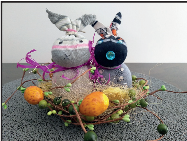
„Zajaczki ze skarpetek.”

Z powodu pandemii koronawirusa wielu mieszkańców, a zwłaszcza dzieci i młodzież, musiało zostać w domach na długie tygodnie. Aby umilić im ten czas, Kozienski Dom Kultury przygotował szereg atrakcji. Wśród nich są różnego rodzaju konkursy z nagrodami, które prowadzone są za pośrednictwem „Kulturalnej grupy KDK”.