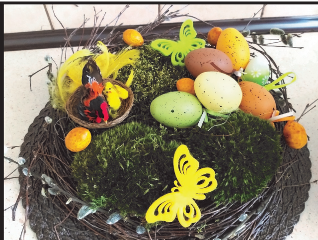
„Wianek z brzozy.”

Pierwszy konkurs ogłosiliśmy już 25 marca i miał on charakter filmowo-fotograficzny. Zatyłłowaliśmy go „Jak spędzamy czas w domu w ramach akcji #zostańwdomu?”. W ramach konkursu, prosiliśmy uczestników naszych zajęć, by zrobili zdjęcia lub nagrali krótkie filmy, na których mieli przedstawić swoje sposoby na spędzanie czasu w domach.