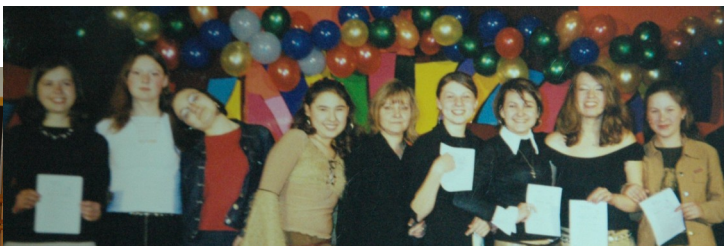
UWAGA: W tym roku świętujemy dwie 18-stki! Wiosną Kronika Kozienicka, a jesienią Młodzieżowa Estrada Piosenki. Przesyłajcie wspomnienia i zdjęcia: dom.kultury@dkkozienice.pl