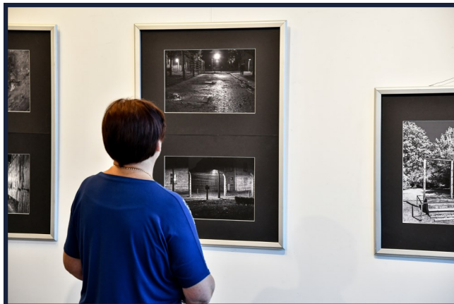
Wystawa „Finis” łączy i prezentuje dwa światy; zatrzymuje ich historię w kadrze.

Fotografią interesuje się od dziecka. Pierwszym aparatem był „Druh” produkcji polskiej, a potem „Zorki 2S” produkcji radzieckiej. Fotografii uczył się w Młodzieżowym Domu Kultury w Radomiu pod kierunkiem instruktora Jerzego Halla. Od 1985 r. członek Radomskiego Towarzystwa Fotograficznego, a także członek rzeczywisty Fotoklubu Rzeczypospolitej Polskiej Stowarzyszenie Twórców z siedzibą w Warszawie. Posiada tytuł: „AFRP” (artysty fotografa/fotografika Fotoklubu Rzeczypospolitej Polskiej). Wyróżniony odznaką „Zasłużony Działacz Kultury”, Medalem 150-lecia Fotografii (1839-1989),