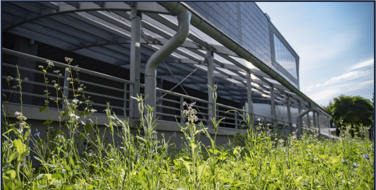
Łąka kwietna powstała na pasie zieleni w pobliżu wjazdu do garażu podziemnego CKA.

Przy Kozienickim Domu Kultury im. Bogusława Klimczuka powstała łąka kwietna. To kolejne z proekologicznych działań naszej instytucji.