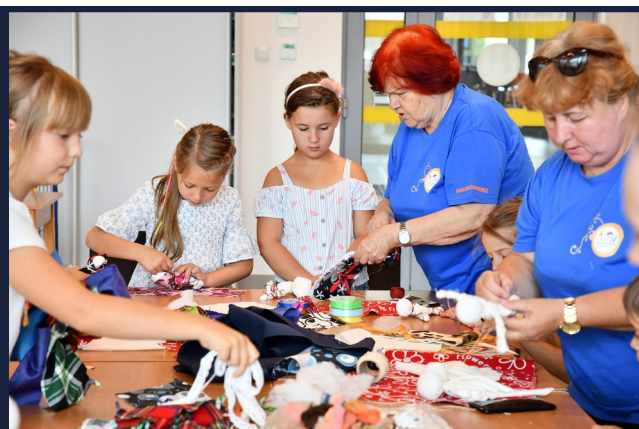
Wolontariuszki z Wolontariatu Seniora Uniwersytetu Trzeciego Wieku Kozienickiego Domu Kultury pokazały dzieciom, jak tradycyjnymi metodami, bez igieł, wykonać „Słowiańskie lalki motanki”.