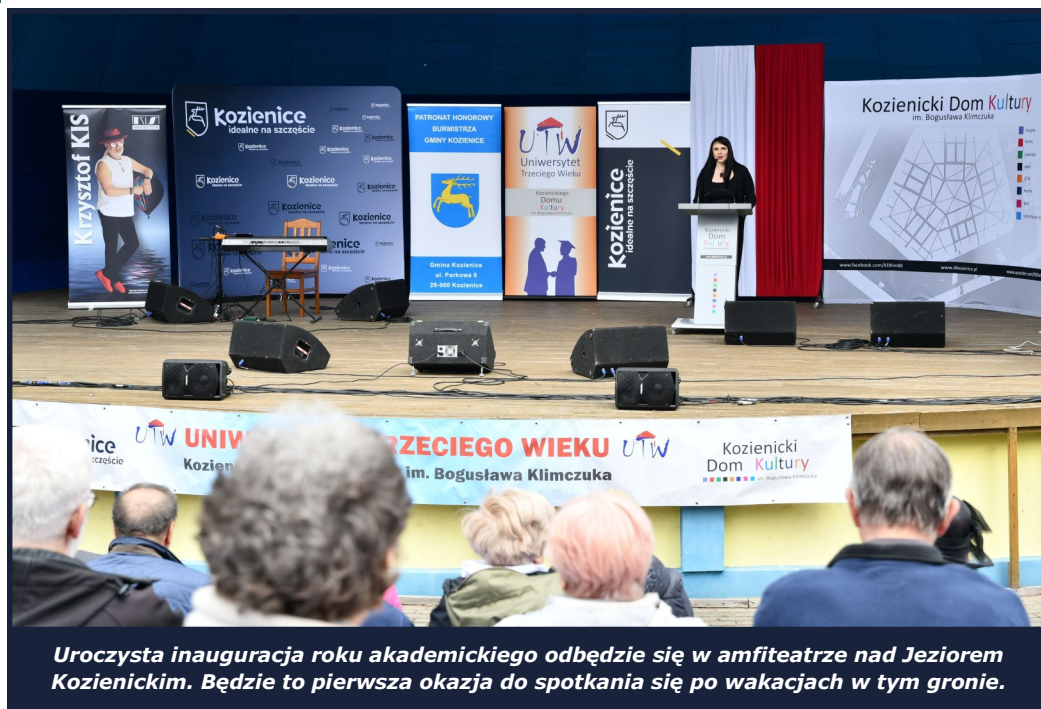
Uroczysta inauguracja roku akademickiego odbędzie się w amfiteatrze nad Jeziorem Kozienickim. Będzie to pierwsza okazja do spotkania się po wakacjach w tym gronie.

Interesujące wykłady specjalistów, pasjonujące zajęcia fakultatywne, miło i twórczo spędzony czas... To wszystko czeka na seniorów, którzy zdecydują się na „studiowanie” na Uniwersytecie Trzeciego Wieku Kozienickiego Domu Kultury im. Bogusława Klimczuka. W środę, 22 września wystartuje jego 14. edycja. Lada chwila ruszą zapisy!