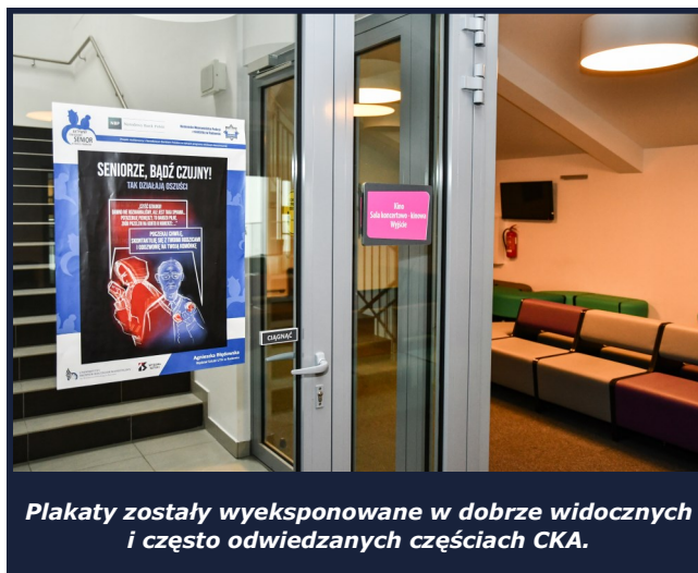
Plakaty zostały wyeksponowane w dobrze widocznych i często odwiedzanych częściach CKA.

Celem projektu jest przede wszystkim zwiększenie świadomości osób starszych (65+) w obszarze finansowym i bezpieczeństwa, tj. w codziennym obcowaniu z finansami, bankomatami i operacjami finansowymi realizowanymi drogą elektroniczną oraz w zakresie przestępstw dokonywanych w bankowości elektronicznej i przestępstw, na które narażeni są seniorzy. Taka wiedza z pewnością przyda się jednak