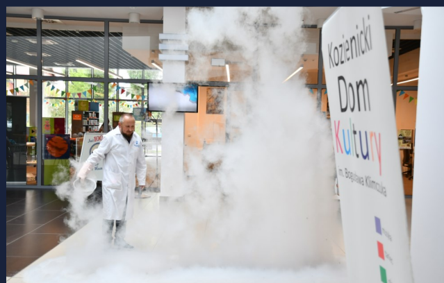
Ogromne zainteresowanie wzbudziły warsztaty chemiczno-magiczne, które poprowadzili animatorzy z Agencji „Modra Sowa”. Jak widać, nauka może być (i jest!) fascynująca.