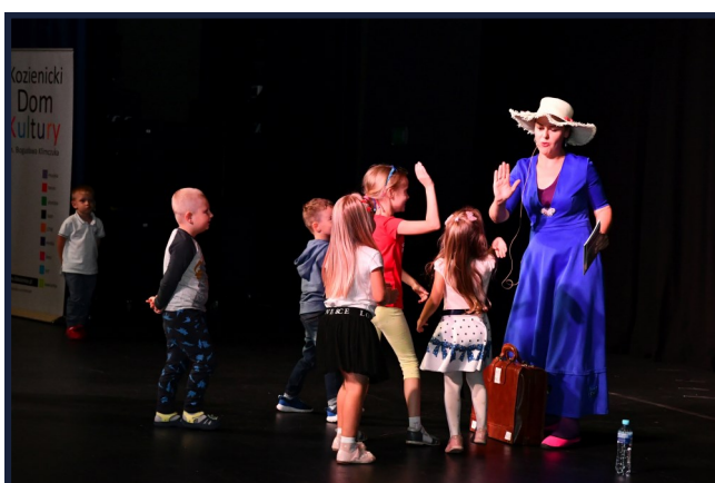
Zaraz po spektaklu dzieci miały chwilę, by przybić piątkę z aktorami i porozmawiać o przedstawieniu.

Organizatorami spektaklu były Gmina Koziensice i Kozienski Dom Kultury im. Bogusława Klimczuka.