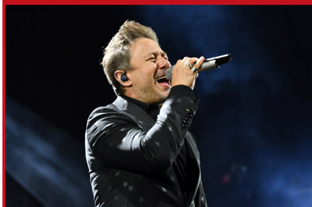
Gwiazdą festiwalu był Andrzej Piaseczny.

Music Award. Był kapitanem jednej z drużyn w programie „Bitwa na głosy” i trenerem w kilku edycjach „The Voice of Poland” i „The Voice Senior”.