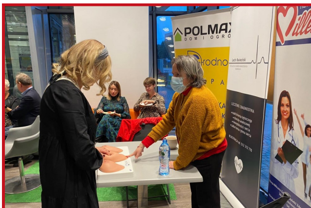
Nieodzownym elementem każdej edycji kampanii są warsztaty z samobadania piersi.