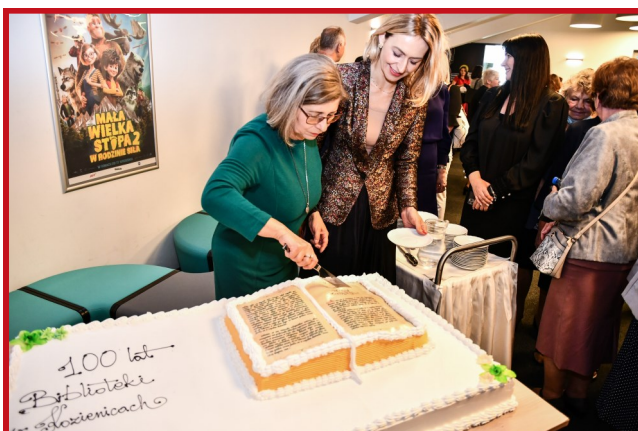
Przy jubileuszu nie mogło zabraknąć słodkiego tortu...