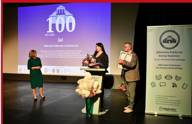
... i wielu ciepłych życzeń dla kadry biblioteki.