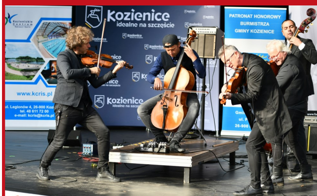
Zespół VOŁOSI dał świetny, energiczny koncert!

prezentując swój własny styl. Tworzą muzykę współczesną, ale wyrastającą z karpaccich korzeni, noszącą przy tym znamiona jazzowej improwizacji, rockowej energii i silnych emocji. Dla kozienskiej publiczności dali niezwykle energetyczny występ, podczas którego nie mogło zabraknąć ich najbardziej popularnych kompozycji.