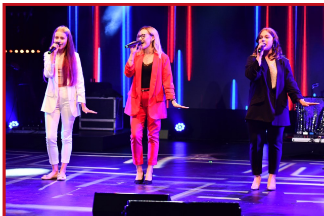
„Tercet KDK” zdobył III nagrodę w wys. 1,5 tys. zł.

Zwieńczeniem festiwalu był koncert jednego z najbardziej popularnych polskich wokalistów – Andrzeja Piasecznego. Piosenkarz od blisko 30 lat z powodzeniem występuje na scenach koncertowych i w programach telewizyjnych. Wydał trzy albumy z zespołem Mafia, 10 albumów solowych, 2 kolejne ze Stanisławem Sojką i Sewerynem Krajewskim, a także 1 album koncertowy. Jest zdobywcą czterech Superjedynek, Wiktora, Fryderyka, Telekamery i Eska