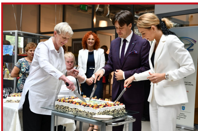
Jak jubileusz, to oczywiście słodki tort.

– Pozwolą Państwo, że dziś nieco inaczej rozwinę skrót WTZ. Dla mnie za tymi literami kryją się: Wiara, Trud i Zespół. To słowa, wartości, które określają to,