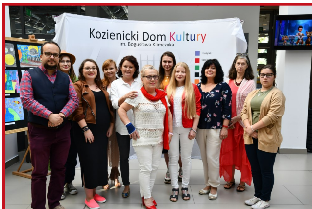
To było kolejne wartościowe i owocne spotkanie lokalnych miłośników pięknego słowa.

Otwarte warsztaty literackie od wielu lat cieszą się