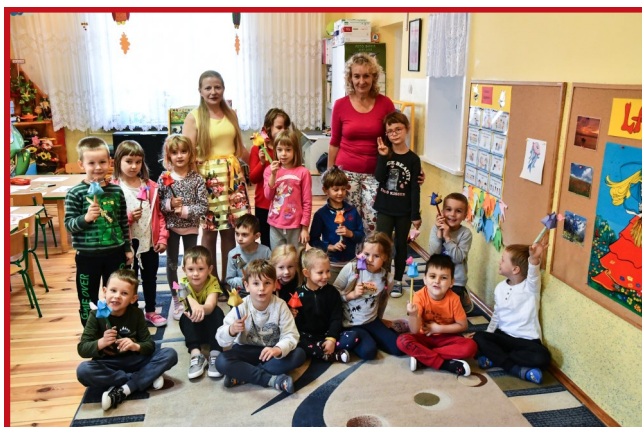
„Pszczółki” uwijały się przy pracy. Dzieci bardzo chętnie brały udział w zajęciach i doskonale się przy tym bawiły. Efekty pracy zobaczymy na wystawie.