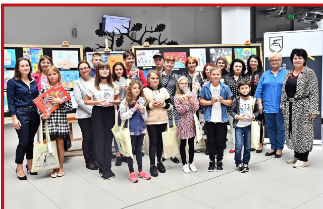
Uczestnicy wraz z opiekunami i jurorami konkursu.

Wszyscy laureaci otrzymali pamiątkowe statuetki oraz nagrody rzeczowe, m.in. gry planszowe.