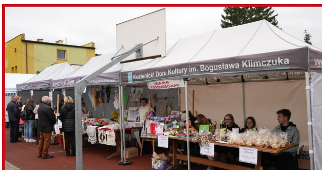
Festyn odbył się na terenie PSP nr 1 w Kozienicach.