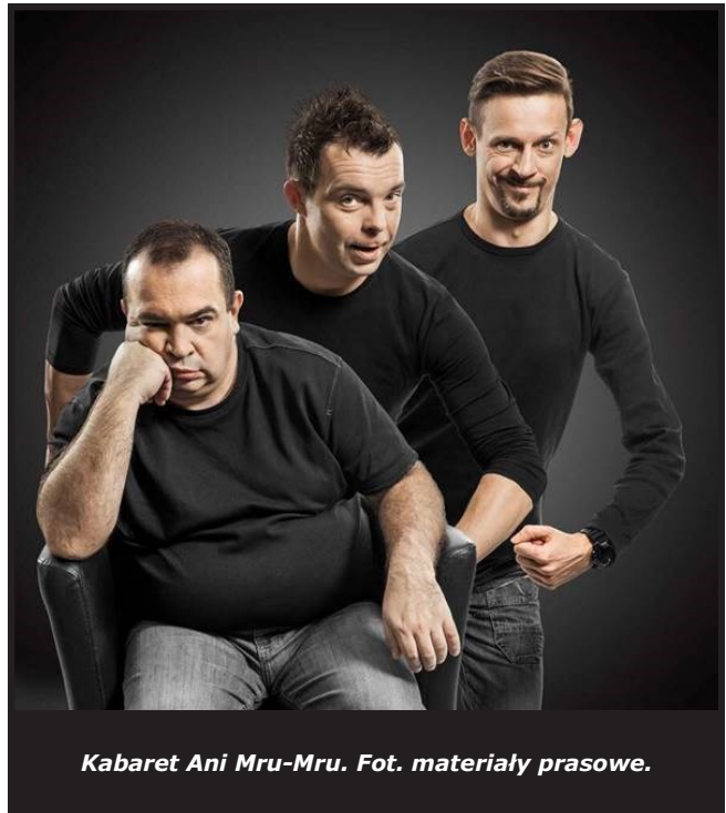
Kabaret Ani Mru-Mru.

Organizatorem występów kabaretu w Koziensicach jest Agencja Artystyczna Kereza. Szczegółowe informacje oraz zamówienia grupowe dostępne są pod