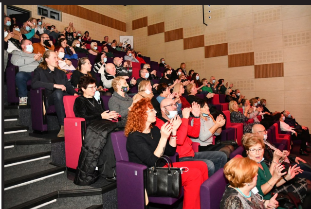
Publiczność świetnie się bawiła i żywo reagowała na to, co działo się na scenie. Było wspólne śpiewanie, wyklaskiwanie rytmu i rozmowy z artystami między poszczególnymi utworami. Świetny klimat!

Koncert potrwał ponad półtorej godziny, a widzowie usłyszeli m.in. przeboje Hendrixa, Claptona, Nalepy, Riedla, a także takich formacji jak Deep Purple, Lombard czy TSA. Co ciekawe, zagraniczne utwory zespół wykonywał do polskich