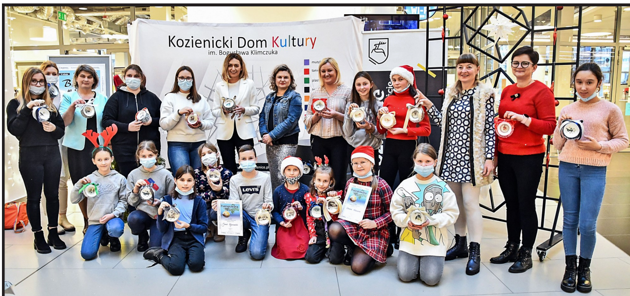
Na koniec warsztatów nie mogło zabraknąć wspólnego zdjęcia – oczywiście z efektami pracy w dłoniach.

W mikołajkowe popołudnie Kozienicki Dom Kultury zaprosił do siebie przedstawicieli szkół z terenu Gminy Kozenice na magiczne zajęcia. W poniedziałek, 6 grudnia, odbyła się bowiem już piąta edycja warsztatów „Bombka w CKA”. Uczestnicy tego wydarzenia, które zdarza się – jak w piosence Czerwonych Gitar – „tylko jeden raz do roku”, przygotowywali niezwykle bombki techniką decoupage.