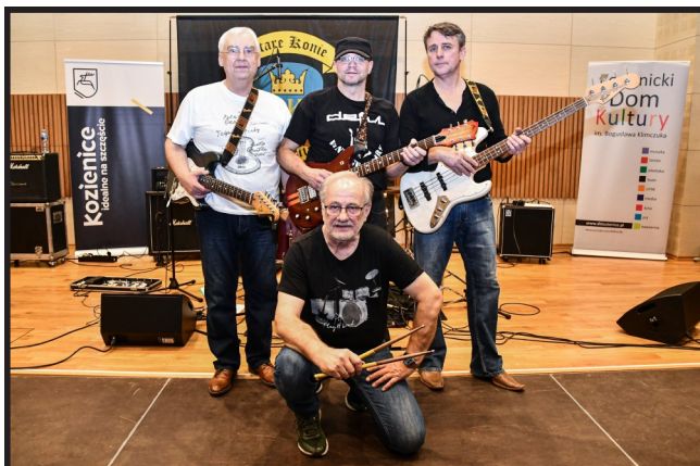
Stare Konie zafundowały swoim słuchaczom dobre, bluesowo-rockowe granie.

Największe polskie i światowe przeboje lat 60., 70. i 80. XX wieku rozbrzmiewały w niedzielę, 28 listopada, w sali kameralnej Centrum Kulturalno-Artystycznego w Kozienicach. Wszystko to za sprawą koncertu zespołu Stare Konie, zorganizowanego z okazji „Andrzejek” przez Gminę Kozenice i Kozienicki Dom Kultury.