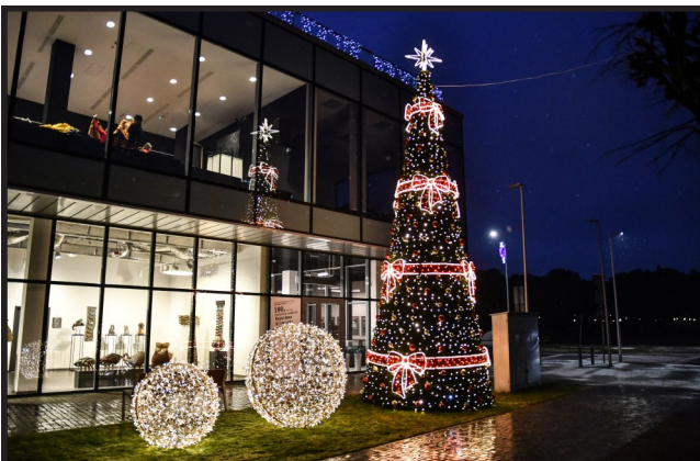
Choinka i bombki rozświetliły teren przed CKA.

Przed naszą siedzibą, Centrum Kulturalno-Artystycznym w Kozienskich, stanęła nowa, przepiękna choinka! Wraz z nią oczy cieszą dwie instalacje w kształcie bombek. Mamy nadzieję, że przypadły one Państwu do gustu. Wróciły też światełka wewnątrz budynku.