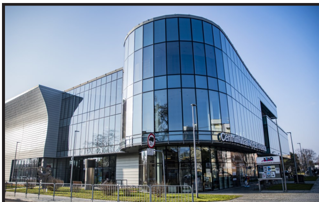
Zmiany dotkną różnych aspektów działalności Kozienickiego Domu Kultury, w tym Kina KDK.

Zmiany nie ominą też Kina KDK, które w ostatnich latach prowadzone było we współpracy z zewnętrznym