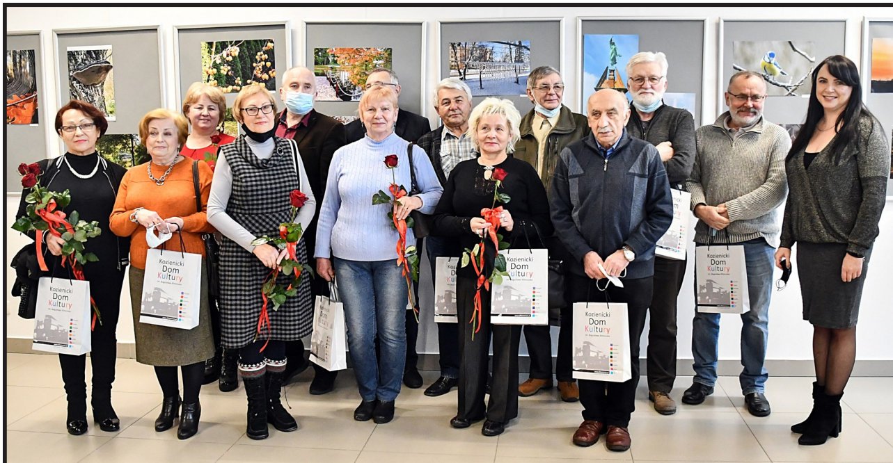
Autorami prezentowanych zdjęć są członkowie zajęć fotograficznych Uniwersytetu Trzeciego Wieku KDK.

„Moje widzenie świata...” to tytuł najnowszej wystawy fotograficznej w Kozienskim Domu Kultury im. Bogusława Klimczuka. W środę, 8 grudnia, w sali na rogu Centrum Kulturalno-Artystycznego odbyło się jej uroczyste otwarcie.