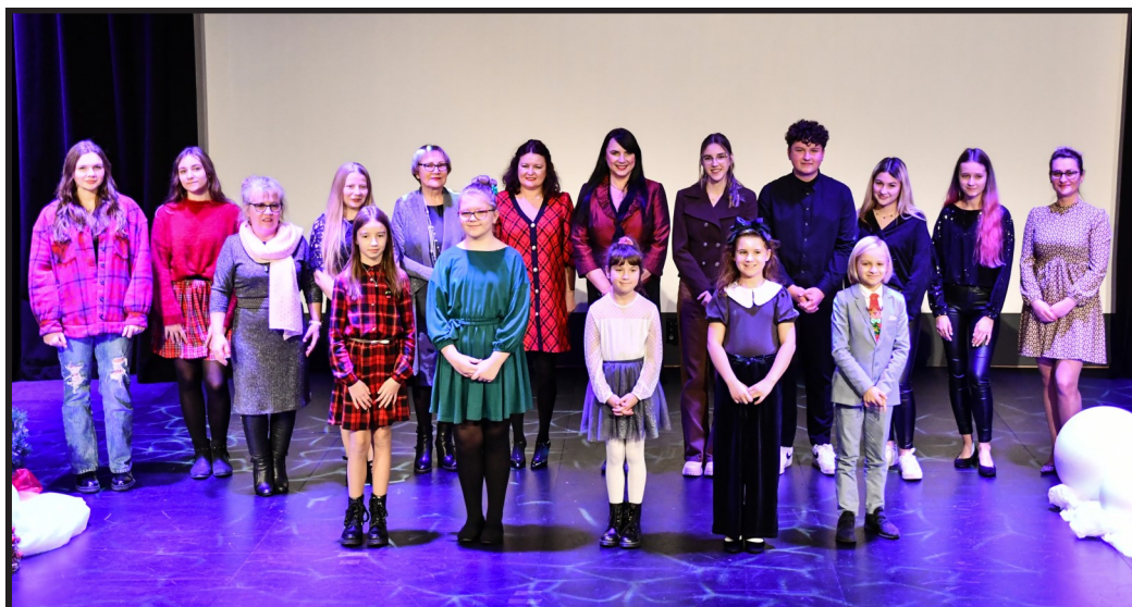
Laureaci konkursu, jego organizatorzy oraz poetki z Grupy Poetyckiej „Erato” KDK.

To był wyjątkowy koncert w świątecznym klimacie. W czwartek, 16 grudnia, w Kozienickim Domu Kultury im. Bogusława Klimczuka odbył się Koncert Galowy laureatów XII Konkursu Kolęd i Pastoralek „Na ten Nowy Rok”, połączony z wręczeniem nagród oraz prezentacją wierszy okolicznościowych poetów z Grupy Poetyckiej „Erato” KDK.