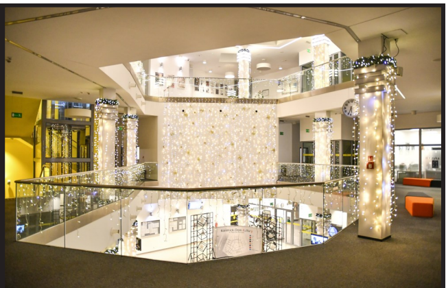
Wnętrze centrum mienią się setkami światełek.