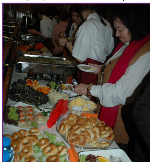
Degustacja tradycyjnych potraw kuchni żydowskiej - na stołach m.in. knysze naziwane puree ziemniaczanym i cebulką, bajgle, czulent, kichlach czy gefilte fish