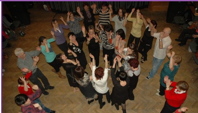
Warsztaty tańca izraelskiego