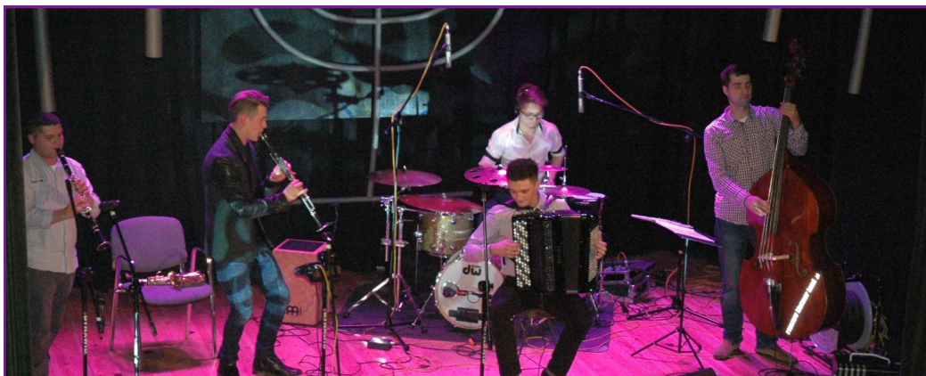
Gościem spotkania z kulturą żydowską był zespół „Rzeszów Klezmer Band”

15 lutego Kozienicki Dom Kultury „tętnił” żydowską kulturą. W sobotnie popołudnie odbyło się bowiem pierwsze spotkanie z nowego cyklu „Kultury Świata”. Atrakcji nie brakowało.