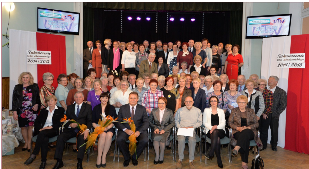
Pamiątkowe zdjęcie uczestników uroczystego zakończenia roku akademickiego 2014/2015 Uniwersytetu Trzeciego Wieku Kozienickiego Domu Kultury.

W czwartek, 21 maja w sali widowiskowej Kozienickiego Domu Kultury, słuchacze Uniwersytetu Trzeciego Wieku zakończyli siódmy rok działalności. Były podziękowania, gratulacje, życzenia, piękne kwiaty oraz dyplomy i nagrody.