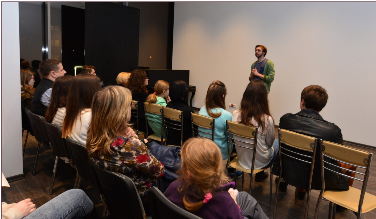
Projekcja filmu przyciągnęła wiele osób, zarówno tych starszych, jak i tych młodszych.

W środę, 9 marca w Centrum Kulturalno-Artystycznym w Kozienicach odbyła się projekcja kilkuminutowego filmu „Wilk” zrealizowanego przez kozienicką młodzież. Materiał ten powstał w trakcie warsztatów filmowych odbywających się w Kozienickim Domu Kultury podczas ferii zimowych.