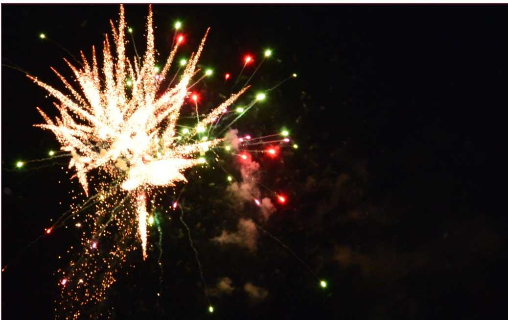
Zwienieniem kozienickich obchodów Światowego Dnia Wody był pokaz sztucznych ogni.

Fontanny Światła - pod takim hasłem przewodnim 19 marca odbyły się kozienickie obchody „Światowego Dnia Wody”. Przed Urzędem Miejskim w Kozienicach nie brakowało gier i zabaw dla najmłodszych, występów artystycznych oraz konkursów z nagrodami. Na finał dnia odbył się widowiskowy pokaz fajerwerków.