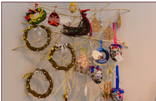
Wielkanocne zawieszki wzbudziły ogromny zachwyt jury.