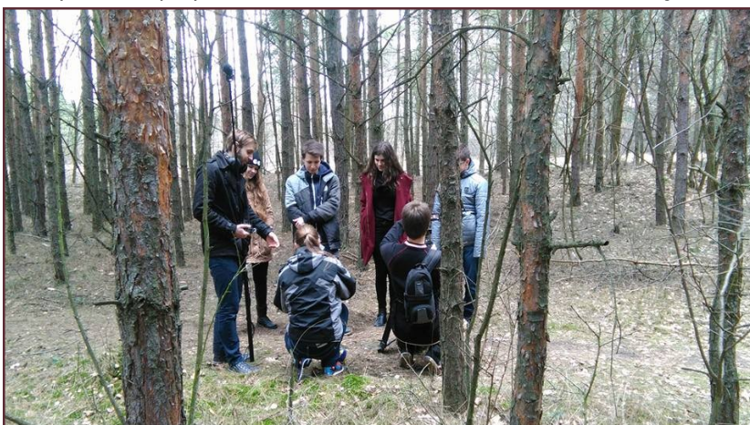
„Wilk” powstał w trakcie warsztatów filmowych odbywających się w Kozienickim Domu Kultury podczas ferii zimowych.