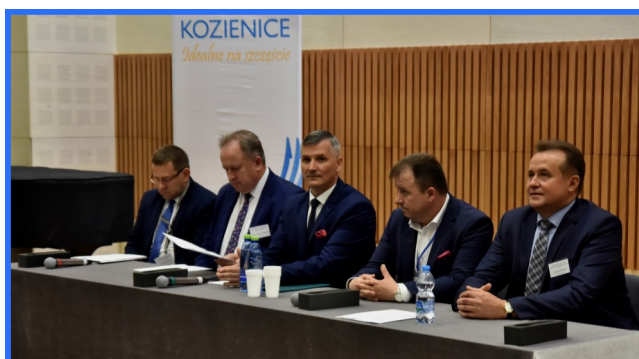
To było spotkanie samorządu i świata nauki.

Podsumowanie konferencji nastąpiło w piątek po południu. Podczas wizyty w Koziensicach, uczestnicy debaty mieli okazję zwiedzić Centrum Kulturalno-Artystyczne i zapoznać się z ofertą KDK.