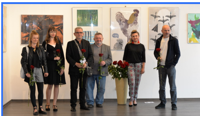
Na najnowszej wystawie w KDK króluje grafika.