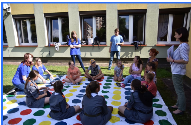
Spotkanie było okazją do doskonałej zabawy i integracji. To był mile spędzony czas we wspólnym gronie.

Wolontariusze ze „Skrzydła” od wielu lat regularnie włączają się w różne akcje, organizują wyjścia, spotkania, patronują zbiórkom plastikowych nakrętek.