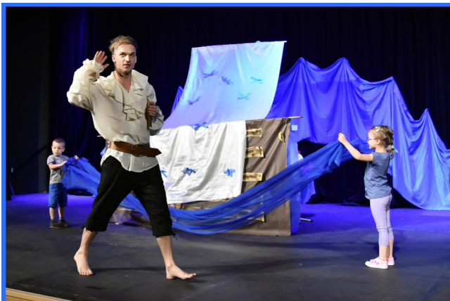
Aktorzy zaprosili na scenę dzieci. Te miały za zadanie m.in. animowanie fal. Tymczasem dorośli zadbali o „szum morza”. Wszyscy świetnie się bawili!

Kolejny „Poranek Teatralny dla Dzieci” już 17 czerwca. Tradycyjnie o godz. 12.00.