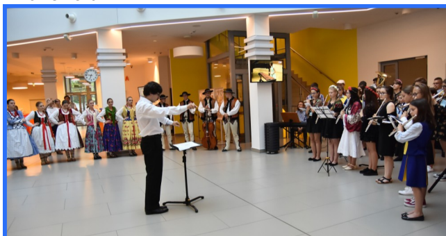
Tegoroczne Folkobranie obfitowało w ciekawe projekty muzyczne, a całość miała góralski klimat.

Organizatorem festiwalu były Szkoła Muzyczna I stopnia w Kozienicach oraz Stowarzyszenie Przyjaciół Szkoły Muzycznej KANON. Kozienicki Dom Kultury im. Bogusława Klimczuka znalazł się w gronie partnerów wydarzenia. Obszerną relację z tego wydarzenia przygotowała telewizja lokalna „Kronika Kozienicka”.