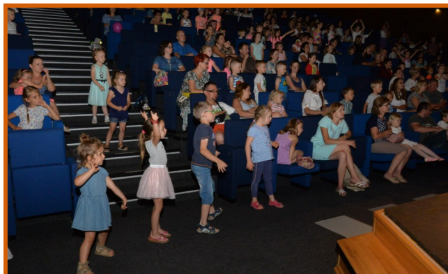
Dzieci chętnie brały udział we wspólnych zabawach, do których zapraszali je aktorzy.

Na kolejny „Poranek Teatralny dla dzieci” zapraszamy już 15 lipca!