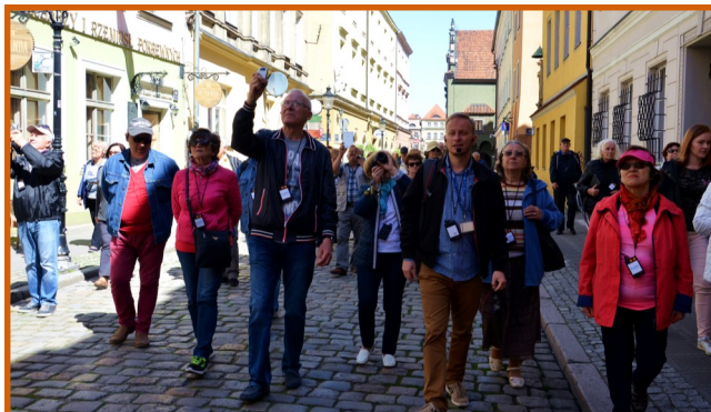
Zwiedzanie, warsztaty, spotkania, integracja... Było super! Każdy dzień obfitował w świetne atrakcje.

Związki Gołuchowa z rodem Leszczyńskich zaakcentowane są poprzez umieszczenie tam ich herb – Wieniawę, jednakże król Stanisław Leszczyński nie zamieszkiwał tam nigdy. Ten zamek jest najstarszym muzeum Czartoryskich w Polsce.