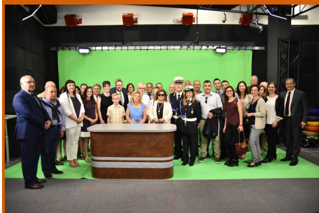
Studio „Kroniki Kozienickiej” zawsze ciekawi gości.