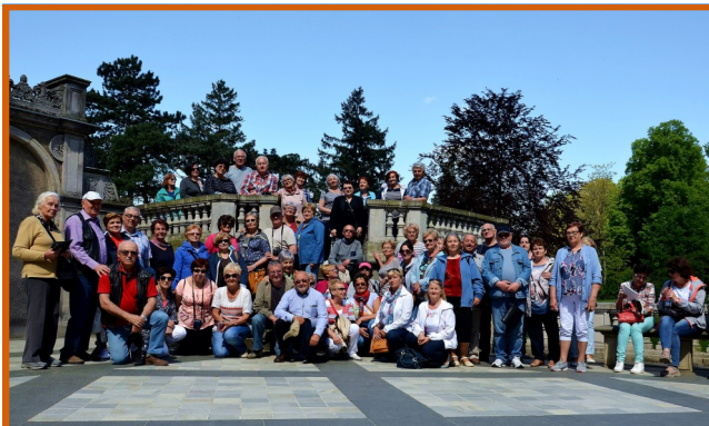
Tym razem, na wspólny wyjazd udało się 58 słuchaczy.

Po tej „uczcie dla oczu”, pojechaliśmy do muzeum prozaika i podróżnika z zamiłowania – Arkadego