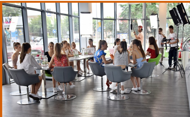
Kandydatki ćwiczyły choreografię na gale, a także brały udział w nagrywaniu spotów telewizyjnych.