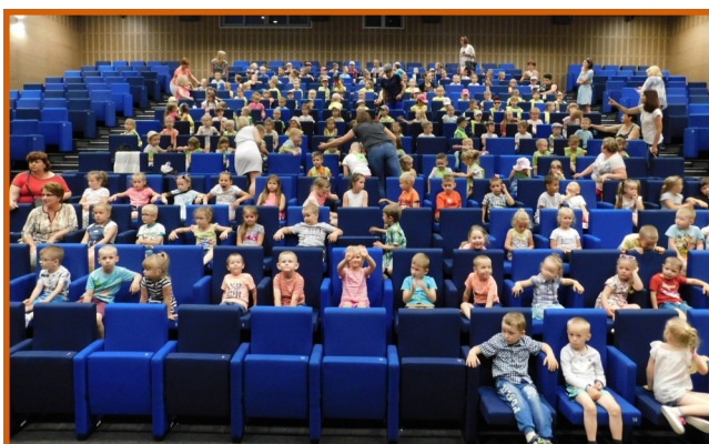
Dzień Dziecka to świetna okazja, żeby wybrać się do kina. W maju i czerwcu gościliśmy wielu maluchów.

Dla naszych widzów mamy jeszcze jedną ważną informację. W dniach 26 lipca - 15 sierpnia Kino KDK będzie nieczynne z powodu przerwy wakacyjnej.