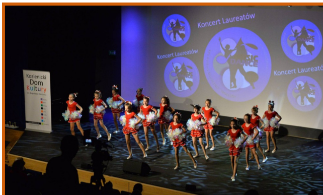
Konkurs od lat służy promocji młodych talentów. Teraz każdy może zobaczyć jak wypadli laureaci.