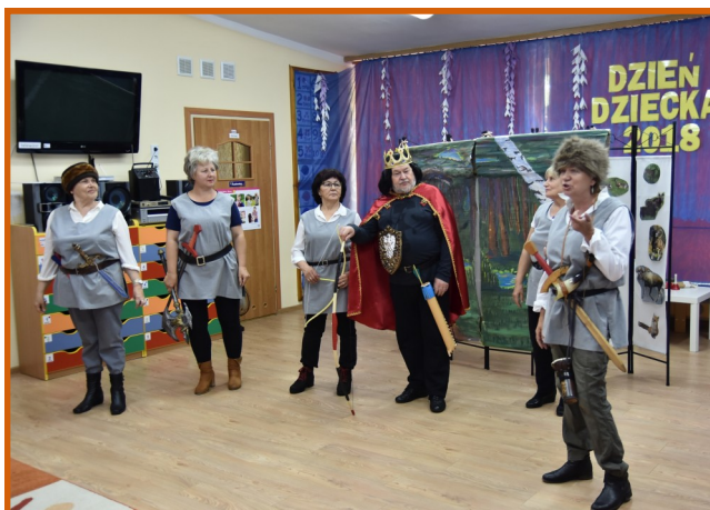
Seniorzy zadbali o barwne stroje i scenografię. Przedstawienie spodobało się młodym widzom.

Tego dnia w PP 1 gościli również wolontariusze z Enei Wytwarzanie, którzy przygotowali specjalne zajęcia dla maluchów. Po prelekcjach odbyły się jeszcze mini-warsztaty plastyczne z seniorami.