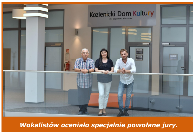
Wokalistów oceniało specjalnie powołane jury.

Wykonawcy śpiewali jeden z dwóch przygotowanych utworów. Niektórzy na prośbę komisji mieli okazję zaprezentować też drugą piosenkę. Po swoich występach odbierali pamiątkowe dyplomy i upominki od pracowników Kozienickiego Domu Kultury. W przygotowanym przez uczestników repertuarze dominowały polskie hity z minionych lat, ale znalazły się w nim też młodsze utwory. Były wykonania odtwórcze, jak również własne aranżacje znanych piosenek.