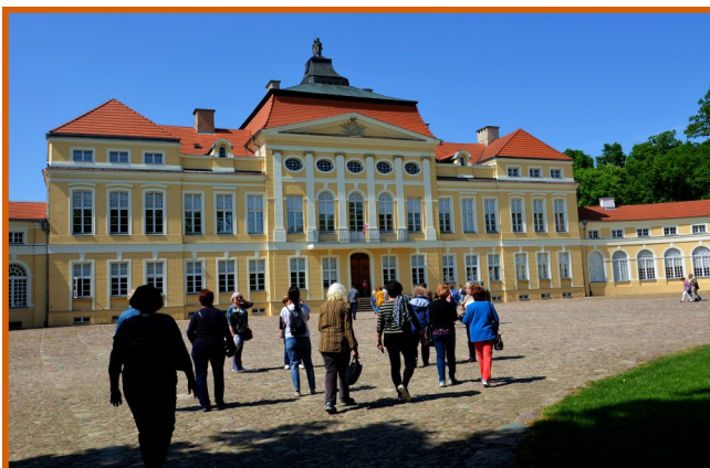
Seniorzy zobaczyli wiele ciekawych miejsc i obiektów.