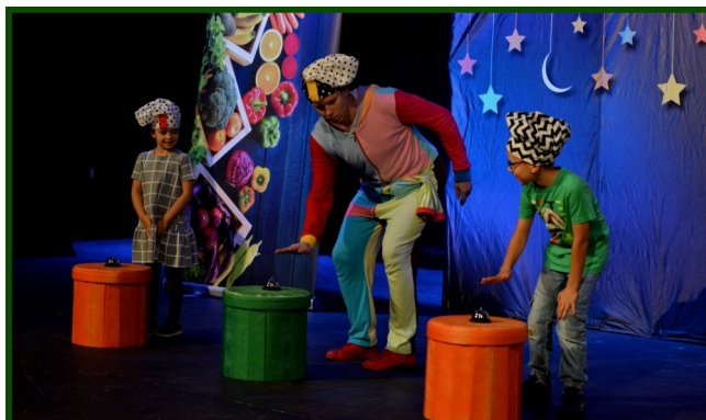
To był przebojowy, interaktywny spektakl.

Dzieci jak zwykle doskonale się bawiły i nagrodziły aktorów gromkimi brawami.