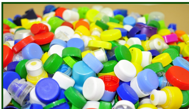
Każdy może pomóc! Wystarczą dobre chęci.

Akcji patronują wolontariusze z Klubu Młodzieżowego Wolontariatu „Skrzydła” z KDK.