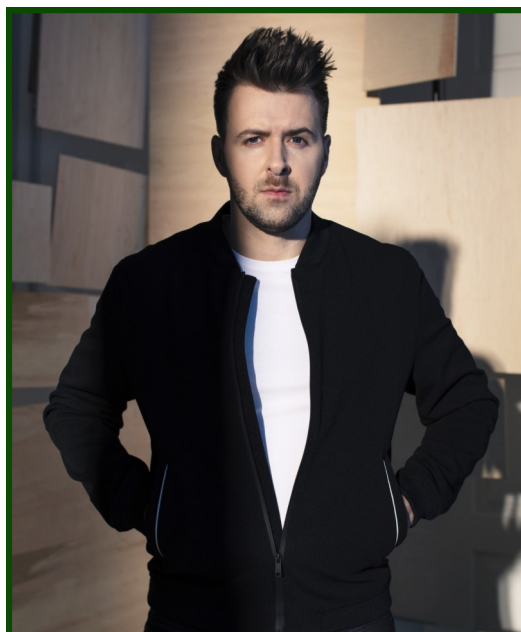
Gwiazdą tegorocznej edycji Festiwalu Muzyki Rozrywkowej będzie Grzegorz Hyży.