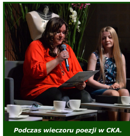
Podczas wieczoru poezji w CKA.