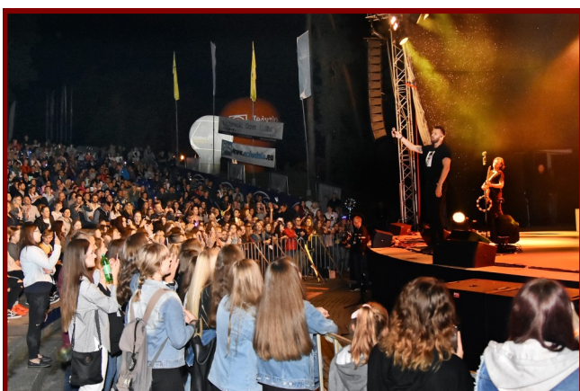
Koncert Grzegorza Hyżego spotkał się z dużym zainteresowaniem ze strony publiczności.