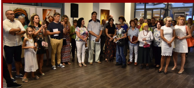
Wystawa spotkała się z dużym zainteresowaniem, a wśród przybyłych rozlosowano jeden z obrazów.