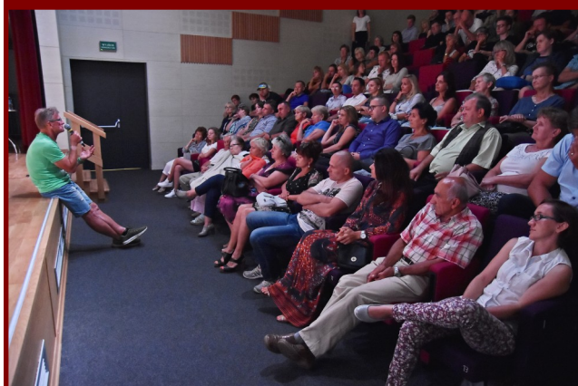
Projekcja i spotkanie cieszyły się bardzo dużym zainteresowaniem. Sala wypełniła się po brzegi. Nic dziwnego — było interesująco.