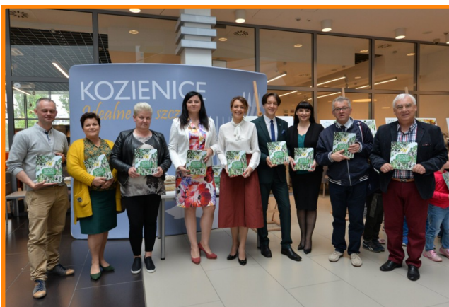
W powstanie i promocję publikacji zaangażowało się wiele osób i instytucji, stąd bardzo dobry efekt.

Docelowo ma trafić do dzieci z gminy Kozienskie w wieku od 5 do 9 lat oraz do nowonarodzonych mieszkańców. Ze swoich egzemplarzy już cieszą się maluchy, które wzięły udział w jej oficjalnej premierze, która odbyła się w Kozienskim Domu Kultury. Promocji towarzyszyła okolicznościowa wystawa ukazująca na dużych planszach ilustracje z tego wyjątkowego wydawnictwa.