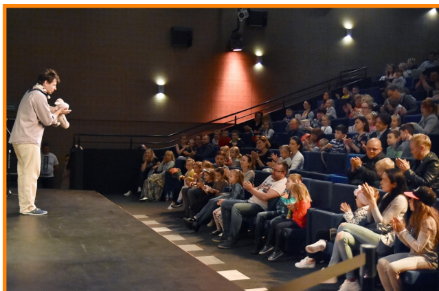
Młodzi widzowie byli bardzo zadowoleni ze spektaklu.

Kolejny poranek już 16 czerwca. Zapraszamy.