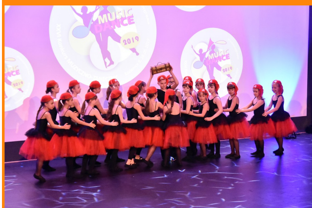
Młodzi artyści zaprezentowali ciekawe układy.

telewizję „Kronikę Kozienicką” i będzie emitowany na antenie „Kroniki” oraz na kanale YouTube Kozienickiego Domu Kultury. Koncert był też okazją do wręczenia nagród dla wszystkich nagrodzonych i wyróżnionych.