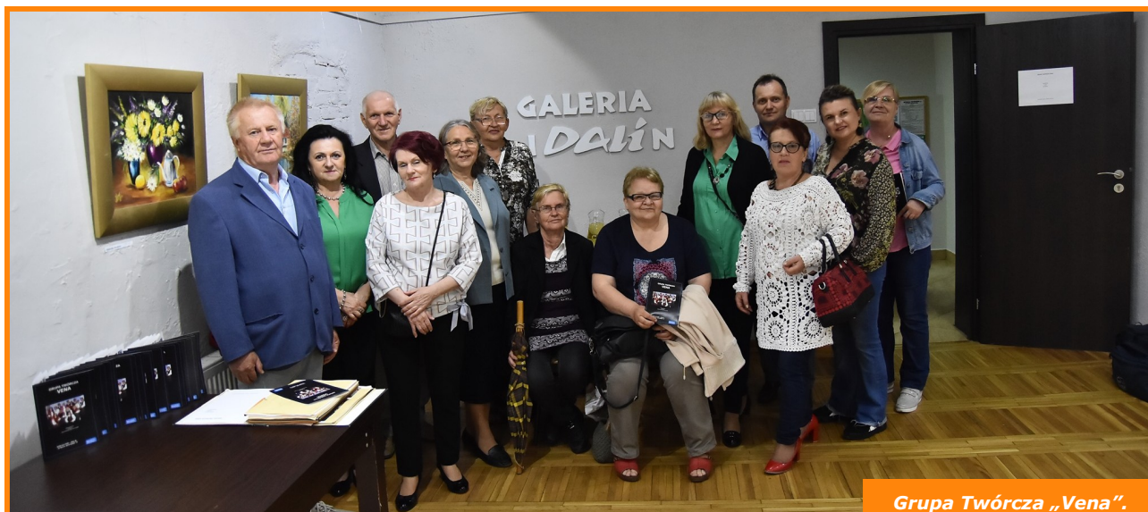
Grupa Twórcza „Vena”.

Artyści z działającej w Kozienickim Domu Kultury Grupy Twórczej „Vena” zaprezentowali swoją twórczość w Radomiu. W czwartek, 23 maja, w Domu Kultury „Idalin” odbył się wernisaż wystawy pt. „Malarstwo, rzeźba, rękodzieło artystyczne”.