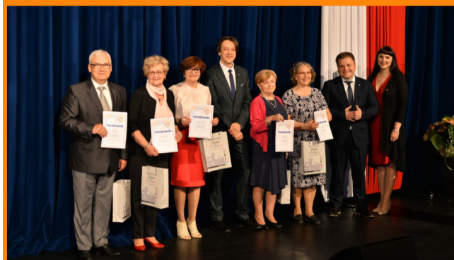
Specjalne podziękowania otrzymali członkowie Rady Słuchaczy Uniwersytetu Trzeciego Wieku.