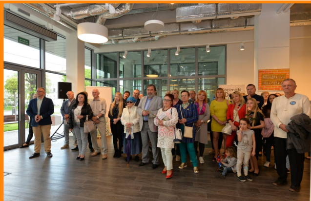
Wystawa spotkała się z zainteresowaniem ze strony miłośników sztuki z Kozienic i okolic.