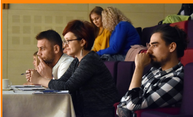
Jury nie miało łatwego zadania. Poziom konkursu był wysoki, a uczestników kilkudziesięciu.

Protokół z wynikami eliminacji wstępnych dostępny jest na stronie KDK pod adresem: www.dkkozienice.pl .