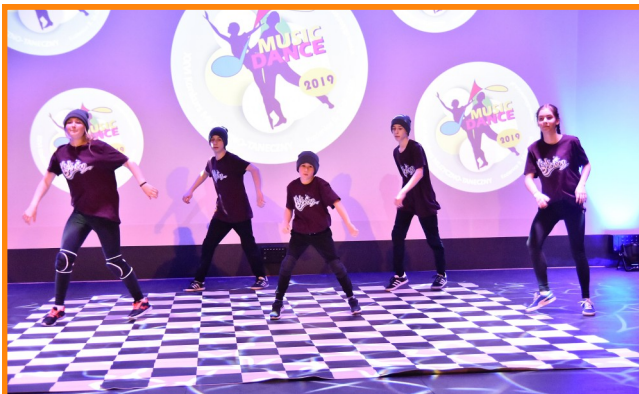
Kozienicki Dom Kultury reprezentowała m.in. grupa „Kids in Action”, która wywalczyła pierwsze miejsce.

Za nami XXVI Konkurs Muzyczno-Taneczny „Music-Dance”. Jego tegoroczna edycja przyciągnęła do Kozienickiego Domu Kultury im. Bogusława Klimczuka: wokalistów, instrumentalistów i tancerzy. Komisje konkursowe miały nie lada zadanie, gdyż w sumie podczas dwóch dni obejrzały i oceniły występy około 800 osób!