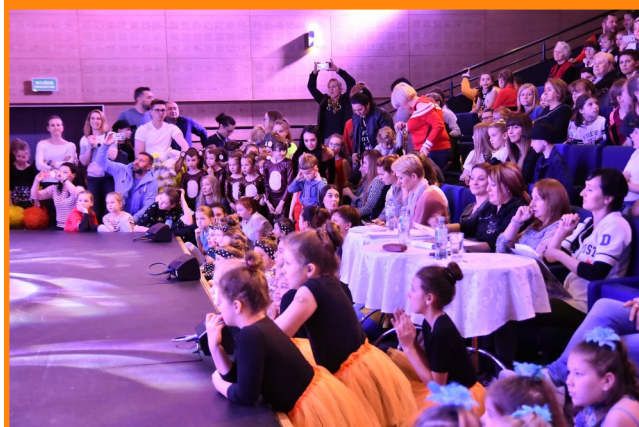
Sala koncertowo-kinowa wypełniła się po brzegi.