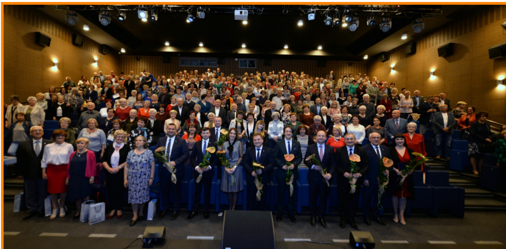
Uniwersytet Trzeciego Wieku tworzą setki osób. To przede wszystkim nasi słuchacze, ale też pracownicy KDK, wykładowcy i osoby, które wspierają jego działalność.