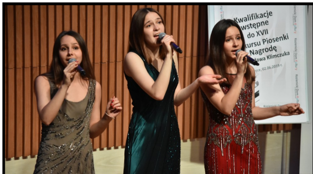
Podczas koncertu finałowego usłyszymy jedno trio: Zespół BLOOM ze Szkoły Muzycznej w Radomiu.