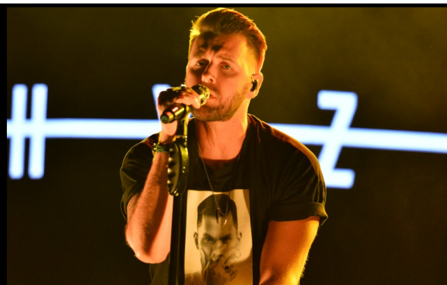
Gwiazdą ubiegłorocznej edycji był Grzegorz Hyży.