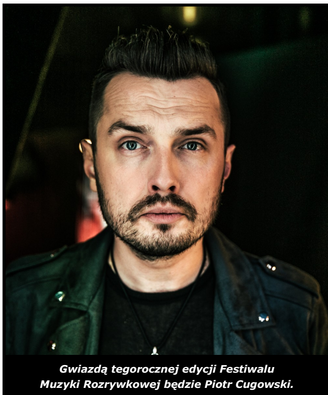
Gwiazdą tegorocznej edycji Festiwalu Muzyki Rozrywkowej będzie Piotr Cugowski.

W ostatnim czasie Piotr Cugowski rozpoczął karierę solową. W październiku ma ukazać się jego pierwszy