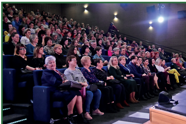
Sala koncertowo-kinowa CKA tego wieczoru dwukrotnie wypełniła się po brzegi!