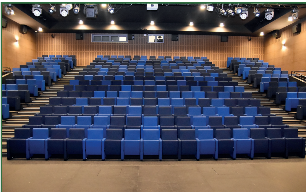
Pusta sala koncertowo-kinowa. Musieliśmy odwołać wszystkie seanse, wykłady, koncerty.

Opustoszałe korytarze i hol, odwołane koncerty, wykłady i zajęcia, brak seansów w kinie. To niestety smutny obraz, jaki przyniósł nam tegoroczny marzec. Pandemia koronawirusa i wprowadzony w związku z nią stan zagrożenia epidemicznego, a później epidemii, odbił się na życiu wszystkich mieszkańców. Zawieszona została również działalność Kozienickiego Domu Kultury im. Bogusława Klimczuka, a nasza siedziba – Centrum Kulturalno-Artystyczne, jest zamknięta dla odwiedzających.