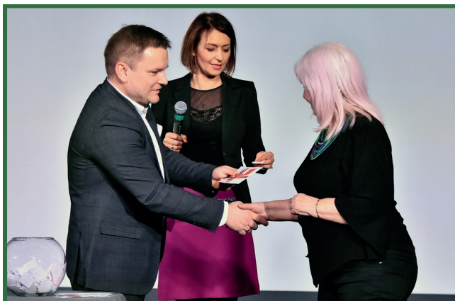
Przed obydwojoma koncertami odbyło się losowanie upominków przekazanych przez KCRiS.

Organizatorami koncertu z okazji „Dnia Kobiet” były: Gmina Koziensice i Kozienski Dom Kultury, a Kozienskie Centrum Rekreacji i Sportu – partnerem. Wydarzenie zostało sfinansowane z budżetu Gminy Koziensice. Po więcej zdjęć odsyłamy na fanpage Kozienskiego Domu Kultury na portalu Facebook, a po relację wideo na nasz kanał YouTube ( www.youtube.com/KDKimBK ).