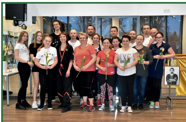
Zajęcia spotkały się z dużym zainteresowaniem. Panie chętnie ćwiczyły podstawowe chwytty.

Organizatorem wydarzenia była Gmina Koziensice i Kozienski Dom Kultury im. Bogusława Klimczuka oraz kozienska szkoła Leung Ting Wing Tsun Kung Fu.