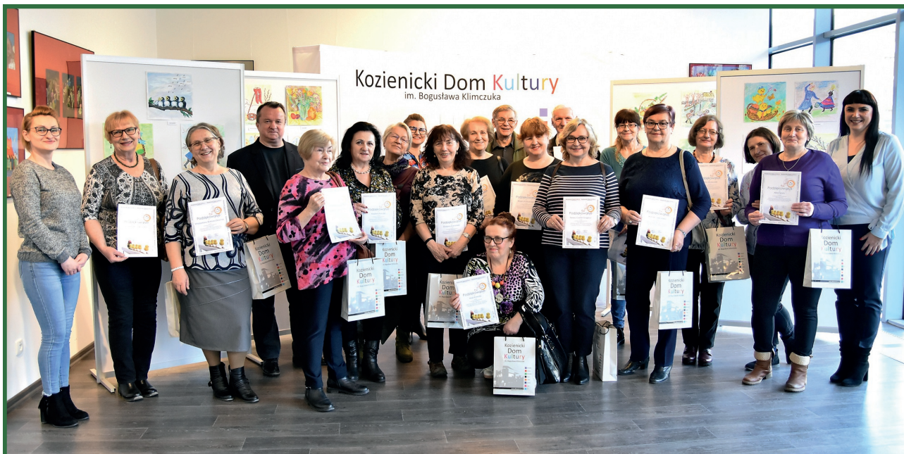
Uczestnicy i organizatorzy konkursu plastycznego „Karta Wielkanocna”, który odbył się w KDK.

W piątek, 28 lutego, oficjalnie rozstrzygnięto konkurs plastyczny „Karta Wielkanocna”, który został zorganizowany przez Kozienski Dom Kultury im. Bogusława Klimczuka.