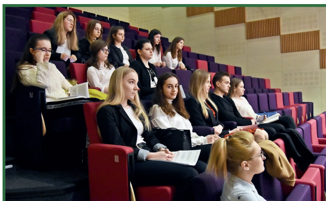
Uczestnicy eliminacji środowiskowych 56. Ogólnopolskiego Konkursu Recytatorskiego.