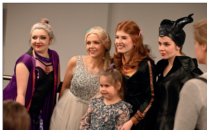
Była też okazja do zdjęć z bajkowymi księżniczkami.

Przedstawienie nie tylko bawiło, ale i uczyło. Historie Disneya zawsze były bogate w wartości takie jak przyjaźń, miłość, odwaga i dobroć. Spektakl „Urodziny Elsy, czyli Bal Księżniczek” kontynuuje tę tradycję, ucząc, które wartości są istotne w życiu. Elsa wybaczyła zły uczynek Urszuli, podkreślając tym jaką rolę odgrywa przyjaźń oraz dawanie drugiej szansy.