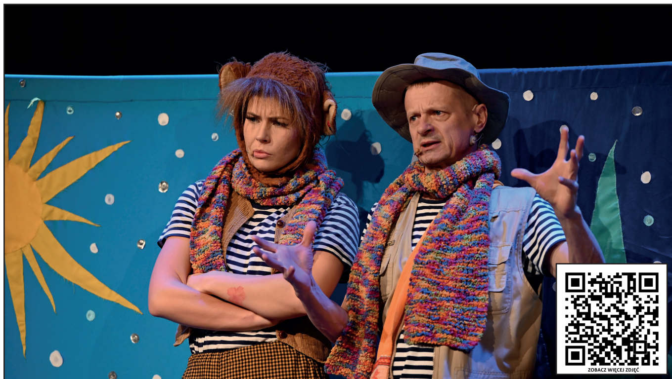
Aktorzy z Grupy Teatralnej Echo z Warszawy zabrali nas w niezwykłą podróż na Biegun.

„Podróże Prof. Kalaflora – Biegun” to tytuł spektaklu z cyklu „Poranki teatralne dla dzieci”, który odbył się w niedzielę, 18 lutego, w Kozienickim Domu Kultury. Na scenie sali koncertowo-kinowej Centrum Kulturalno-Artystycznego wystąpili aktorzy z Grupy Teatralnej Echo z Warszawy.