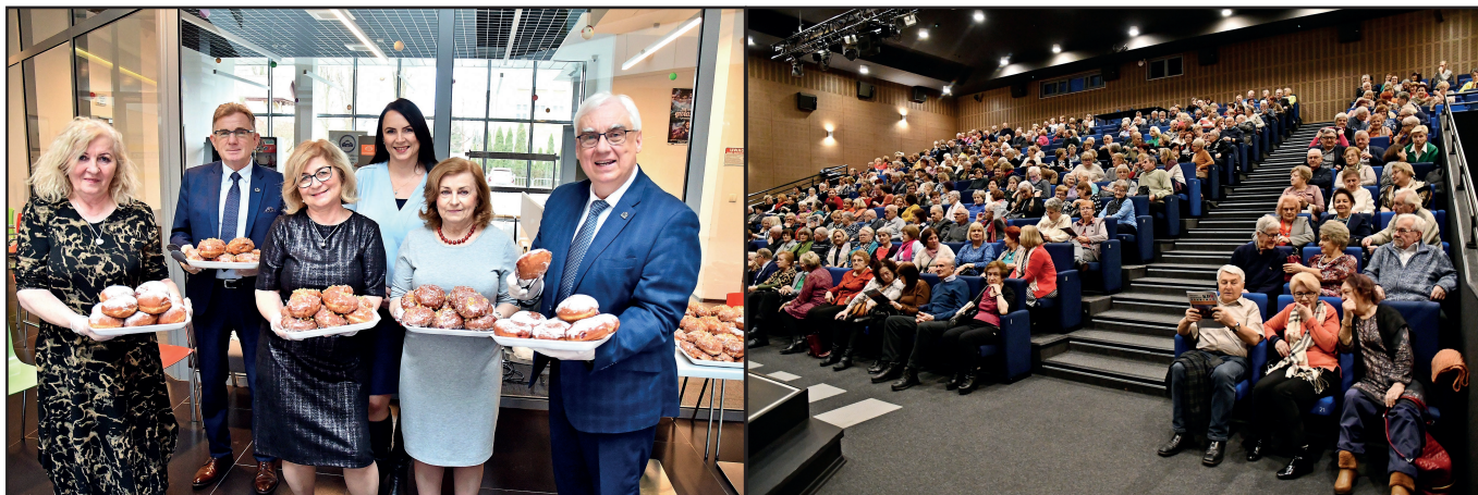
W lutym Rada Słuchaczy zorganizowała Dzień Pączka na pożegnanie karnawału, ale nie brakowało też ciekawych wykładów, które co środę przyciągały do nas tłumy seniorów.

To był intensywny miesiąc dla naszego Uniwersytetu Trzeciego Wieku. W poniedziałek, 29 stycznia, skończyły się ferie zimowe, a nasi słuchacze wrócili do studenckich „ławek”.