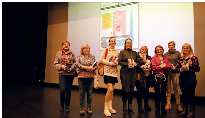
Na widzów ponownie czekały nagrody.

Dodatkową atrakcją wieczoru było losowanie nagród książkowych od Kinads Media w ramach akcji „Kobiety wieczór w kinie KDK”.